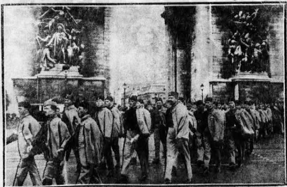
Pred Arc de Triomphe: naši Sokoli nakon polaganja venca na grob Neznanog junaka

5. Nije istina, da vršim akciju izvan sokolskih redova, već u redovima učiteljstva, koji treba da postanu Sokoli, odnosno Sokolice, i da predaju telesnu vežbu po sokolskom sistemu. Istina je, da nastojim učiteljstvu dati znanje i svest za ono što im naredba određuje. Do danas prošlo je do 1000 učitelja i učiteljica kroz tečajevе, o kojima sam pod svojim potpisom izneo, kakvi su i ko ih je organizovao. Uspeh je očigledan, a tim putem ide većina župa pa i zagrebačka. U članu, koji ću u septembru izneti u »Sokolskom Glasniku«, biće do detalja navedeni razlozi i verujem, da će se odobriti. Svedoci: uprava društava u svim mestima, u kojima sam radio