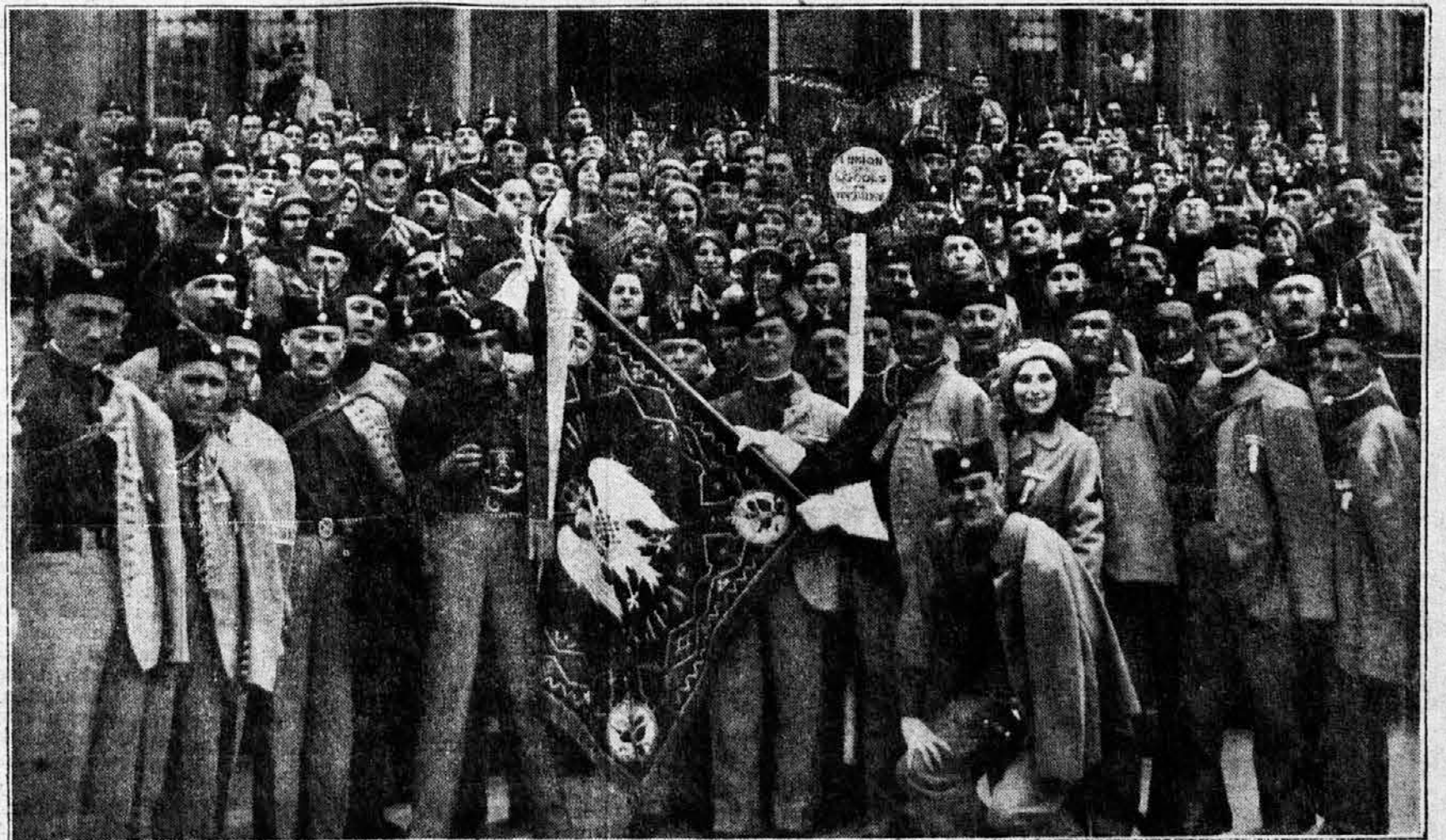
Sa boravka naših Sokola - izletnika u Parizu: pred palatom Pariške općine nakon svečanog prijema

puta proslavljena na medunarodnim i olimpijskim takmičarskim arenama. Iako se je u tim krugovima veoma dobro znalo, da su u ovim borbama najopasniji takmaci jugoslovenski i čehoslovački Sokoli, nosioci mnogih pobeda i svetskih šampionata, nije se ni pomišljalo, da će ova takmičenja, sa svojim teškim zahtevima — zahtevima svestrane gimnastičke izvežbanosti i tehničke rutine — otkriti na gimnastičkom firmanentu jednu novu zvez-