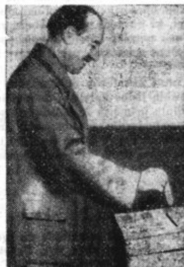
Belgijski ministrski predsednik (premier) van Zeeland pred volilno žaro, ko je oddajal svoj glas, se razume, za sebe

Za popolno razumevanje tega pojava je treba pač poznati rusko zgodovino. Za slovanski svet pa je vsekakor razveseljivo dejstvo, da bo — po vseh znamenjih sodeč — iz krvi in trpljenja vstal kot zmagovalec preroden ruski človek. Brez dvoma bodo skušnje in dognanja v času revolucije v marsikaterem oziru oplodile rusko dušo in po njej ves svet. In to je sad, ki ga ne smemo podcenjevati, ne glede na to, v kakšnem odnosu je kdo do boljševizma. Kajti če boljševizem kot zablodo v celoti odklanjamo,