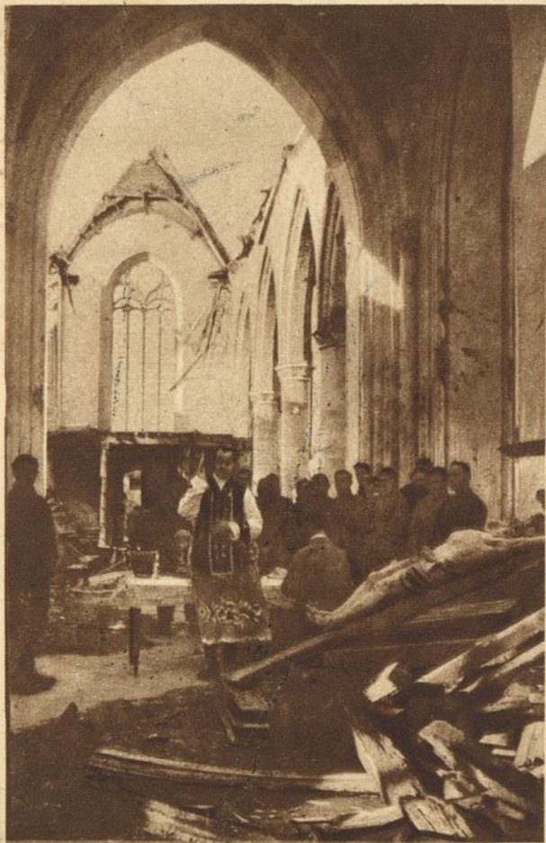
6. Ce que les Allemands font de nos églises