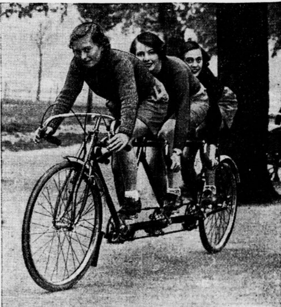
V Franciji uvajajo v javni promet nov bicikel za tri osebe, ki napravijo s tem vozilom lahko do 60 km na uru