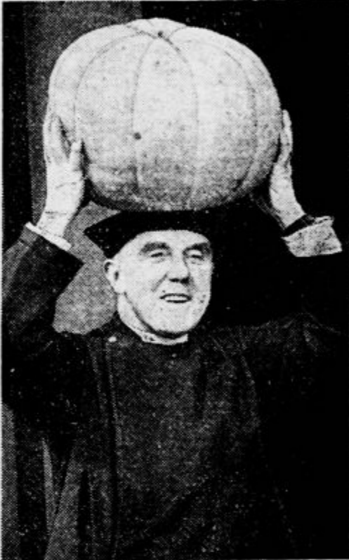
Angleški pastor razkazuje s ponosom ogromno bučo, ki jo je pridelal na svojem zemljišču