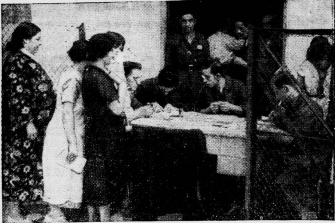
Španski prestolnici prede trda. Čete nacionalnih generalov so se mestu že tako približale, da je madridska vlada strogo racionirala živila, ki jih izdajajo samo proti izkaznicam