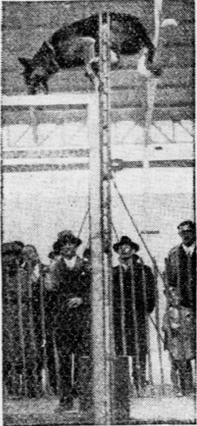
V Versaillesu so te dni pridrili tekmo psov v skakanju na visoko. Nagrado je dobil pes, ki je skočil v višino 2.50 m