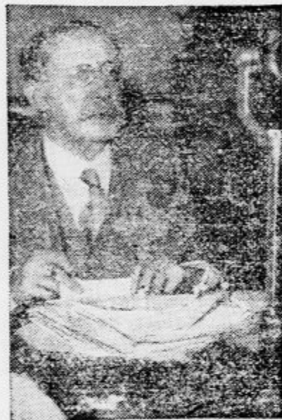
Predsednik francoske vlade Leon Blum se je v svojem zadnjem velikem javnem govoru priznal k tradiciji francoske revolucije iz 1. 1789.