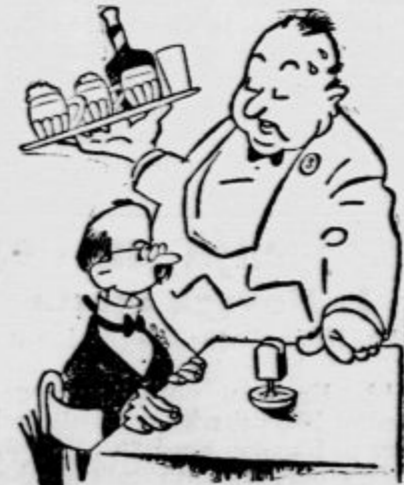
»Prosim, prinesite mi čašo mleka!« »Obžalujem, pri nas ne točimo mleka. Če si ga želite, vam ga lahko pokažemo v knjigic.« (Politikenc)