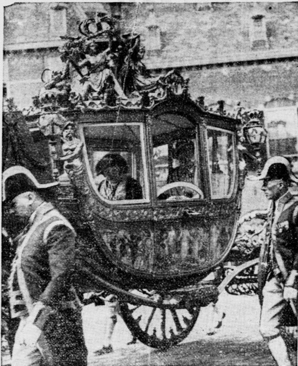
Kraljica Viljemina in prestolonaslednica princesa Julijana se peljeta k otvoritvi holandskega parlamenta v zlati kočiji