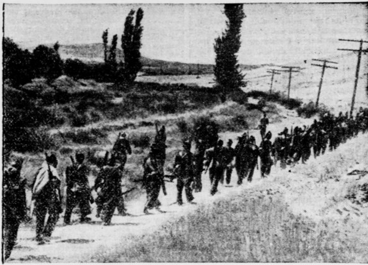
zato ojačuje španska vlada svoje čete najbolj v okolici Talavera