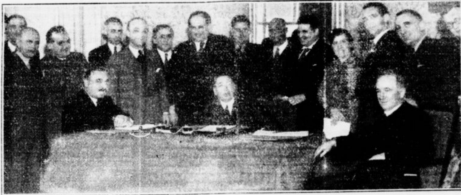
Državniki Male antante med novinarji v bankski palači