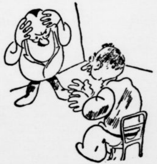
»Joj, joj, kako me boli glava...« »Imel sem prijatelja, ki ga je bolela noga, tako, kakor vas glava, pa so mu morali zaradi bolečin odrezati nogo...«