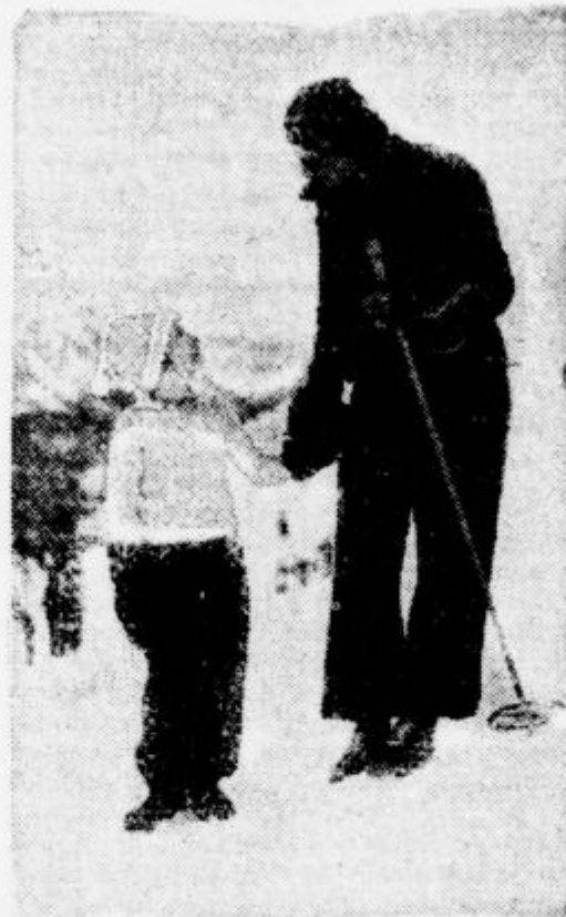
Belgijska kraljica Astrid s svojo prvorojenko princoso Josephino Charlottjo na smučanju v St. Moritzu