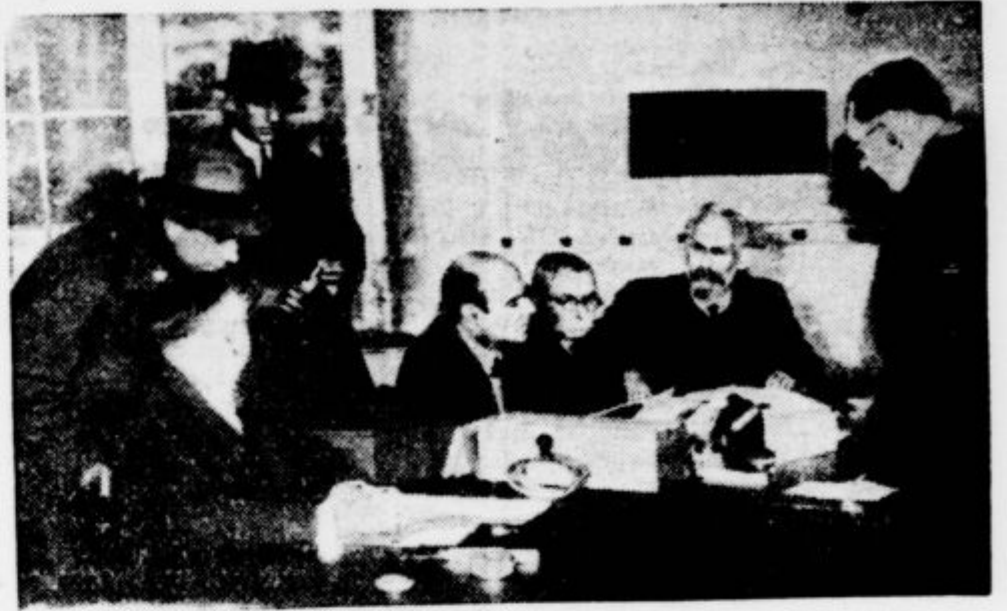
V nedeljo 13. t. m. bodo prebivalci Posaarja odločili priпадnost svoje domovine. Volilni sezname vsebujejo 550.000 imen, volilci bodo metali glasovnice v 862 žar. Uradniki lahko volijo že sedaj.