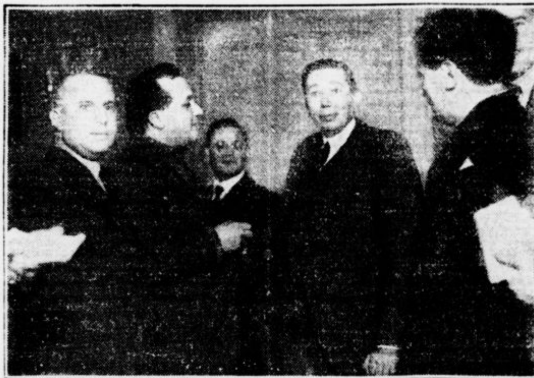
G. Titulescu v razgovoru z novinarji

teljev zunanje politike držav Male antante. Dr. Beneš je še pristavil, da bo iz ljubljanske skupine z rumunskim zunanjim ministrom Titulescom odpoval v Ženevo, kjer bosta imela priliko, da se razgovorita z drugimi evropskimi državniki, ki so zainteresirani na rimskih dogovorih.