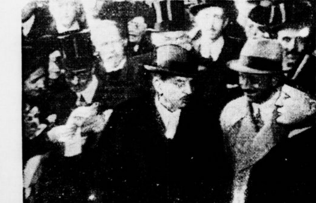
Francoski in italijanski državnik se poslovljata pri odhodu Lavala v Pariz na postaji v Rimu