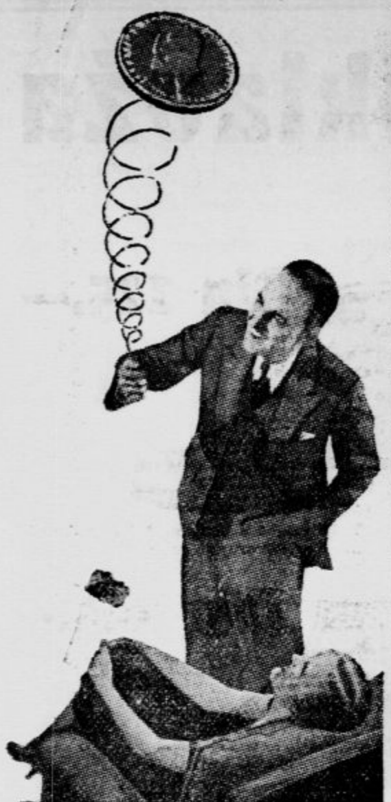
Takole sva metala ...

denar v zrak, ne da bi vedela, zakaj sva ga napravila. Sedaj pa vodiva gospodinsko knjigovodstvo. Vsak dohodek (ki ni velik) in izdatke zapisava v koledar »žene in domač«.