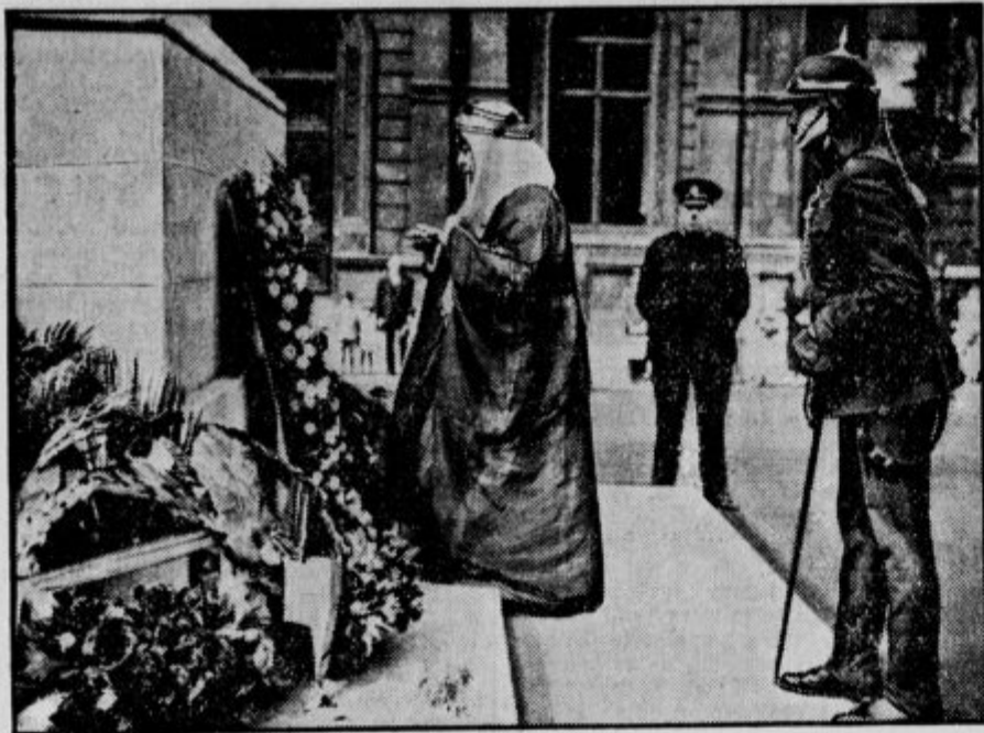
Emir Abdulah, vladar Transjordanije, je te dni obiskal angleško prestolnico. Položil je tudi venec na grob padlim junakom.

Jules Verne pripoveduje v neki knjigi, kako so na zemlji gledali sliko, ki je kazala življenje v podmornici, ki se je razvijala istočasno. Ta fantazija se je danes uresničila. Lenuhi bodo lahko v svoji sobi ali celo v spalnici prisostvovali razburljivim tekmam, ki bodo potekale morda 50 km daleč proč.