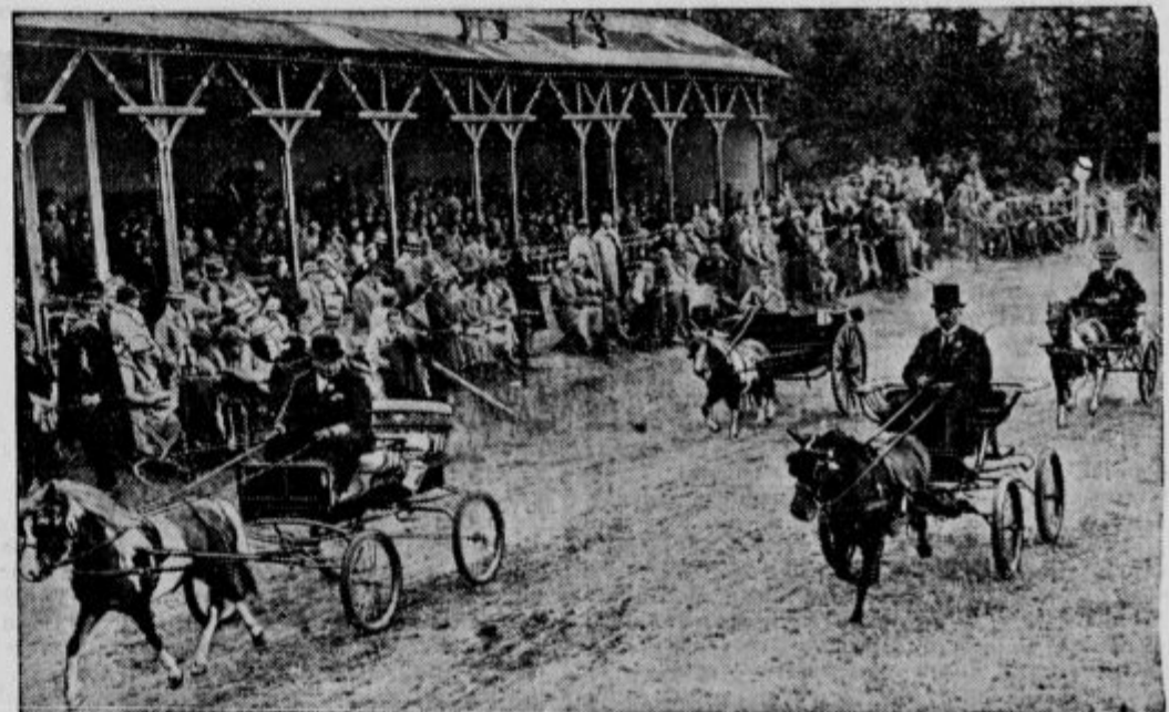
Na Holandskem so priredili nenavadno konjsko dirko. Dirkali so s poniji (pony = majhen konjiček). To bi bila igrača za naše malčke!

Nedaleč od groba prejšnjega japonskega cesarja so pokopali admirala Togo. Pogrebni obred je trajal od zore do solnčnega zahoda. Pogreba se je udeležilo en milijon ljudi.