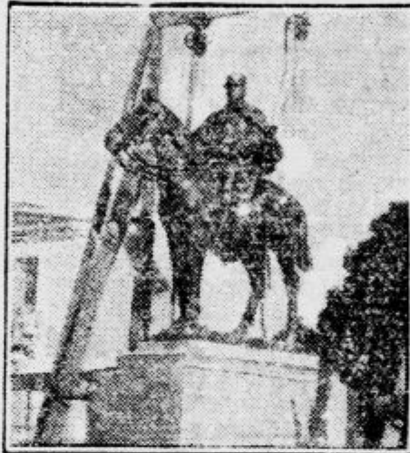
V Rivesaitesu so slovesno odkrili spomenik zmagovalcu ob Marni