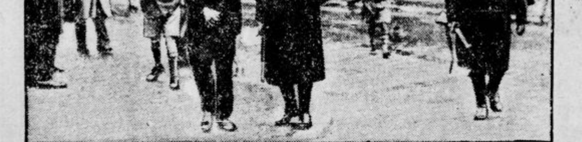
Zgoraj: zaprte trgovine v univerzitetnem delu Madrida. Spodaj: Aretacije upornih dijakov. Na španskih univerzah so organizirali katoliški dijaki ostre nemire. Morala je posredovati policija, ki je izvršila številne aretacije