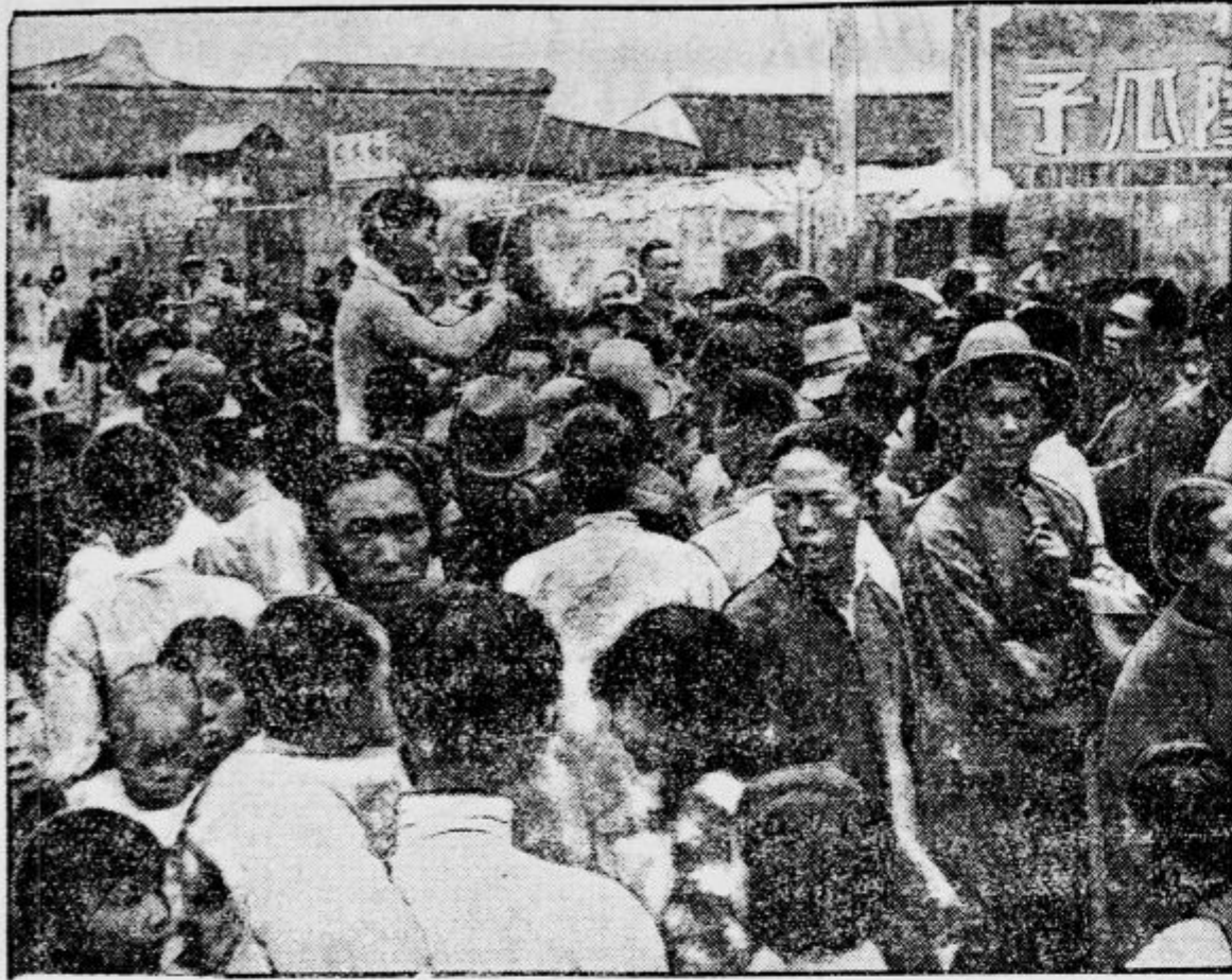
Po vsej ogromni kitajski državi je povzročil japonski vpad v Mandžurijo velik odpor. Po vseh mestih se širi propaganda za bojkot japonskega blaga — edino sredstvo, ki je preostalo Kitajski. Slika kaže kitajskega cestnega govornika, ki poziva množico na bojkot