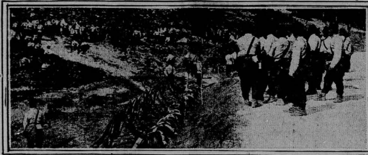
THE ROMANIAN INFANTRY WHICH HAS BEEN CALLED UP TO JOIN IN THE NEW WAR, IN THE BALKANS. FROM THE SWISS.