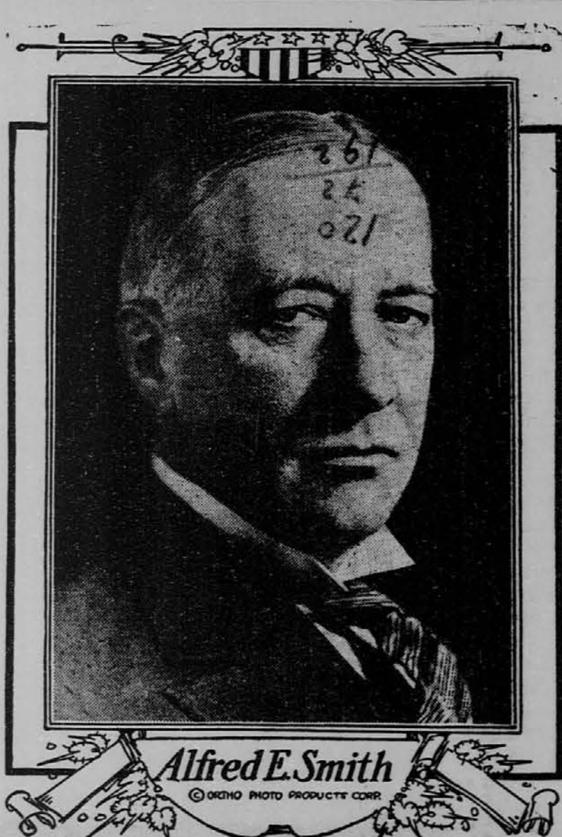
Slika nam predstavlja newyorškega guvernerja Alfreda Smitha, ki kandidira na demokratski listi za predsednika Združenih držav.