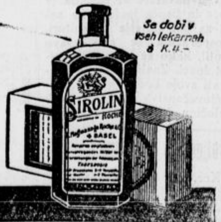
Se dobi v vseh lekarnah & K. A. —