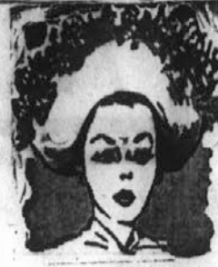
NAŠA MICKA IMA TUD BESEDO

Ker sem ravno pri tem, se čutim dolžna, da se na tem me-