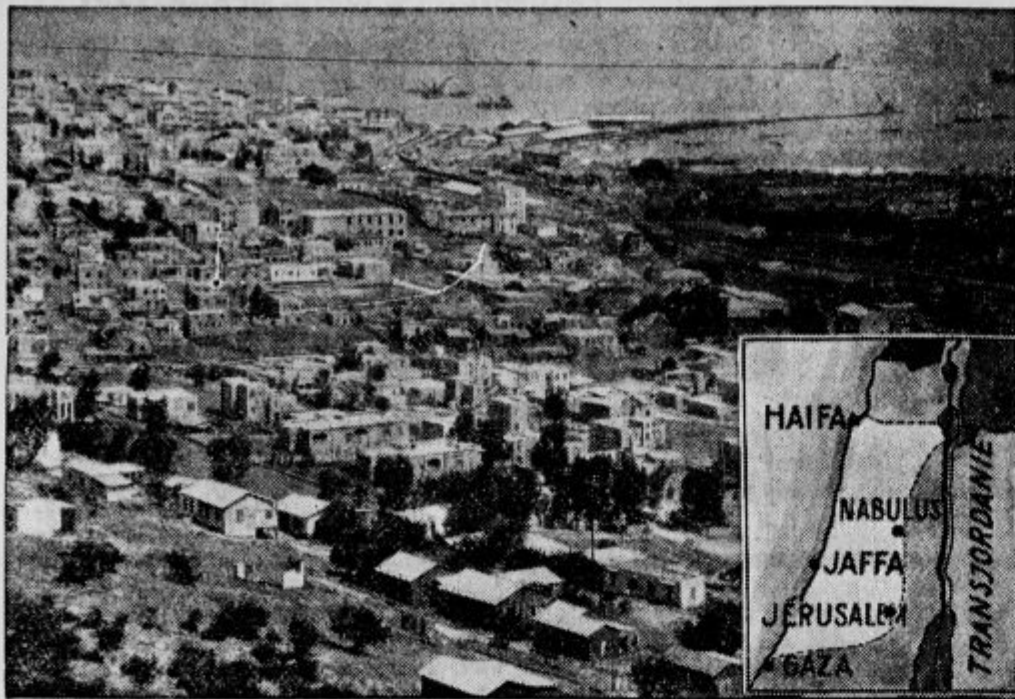
Da bi Angleži preprečili trenja med Judi in Arabci v Sveti deželi, jo hočejo razdeliti v dva dela. En del z Jeruzalemom in skoro vsemi lukami bi dobili Judje, drugi del pa Arabci. Arabski del bi spadal pod Transjordanijo.