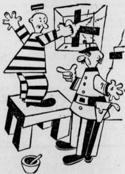
Jetniški paznik: »Ali se ne sramujete v nedeljo delati?«

Uprava živalskega vrta naglašata, da sta tigrata nenavadno mirni živali, kateri sta tako krotki, da je čisto nemogoče, da bi bila strežaja nalašč napadla. Ko bi bila tigrata strežaja hotela zares napasti, ki ga nobena sila ne mogla rešiti smrti.