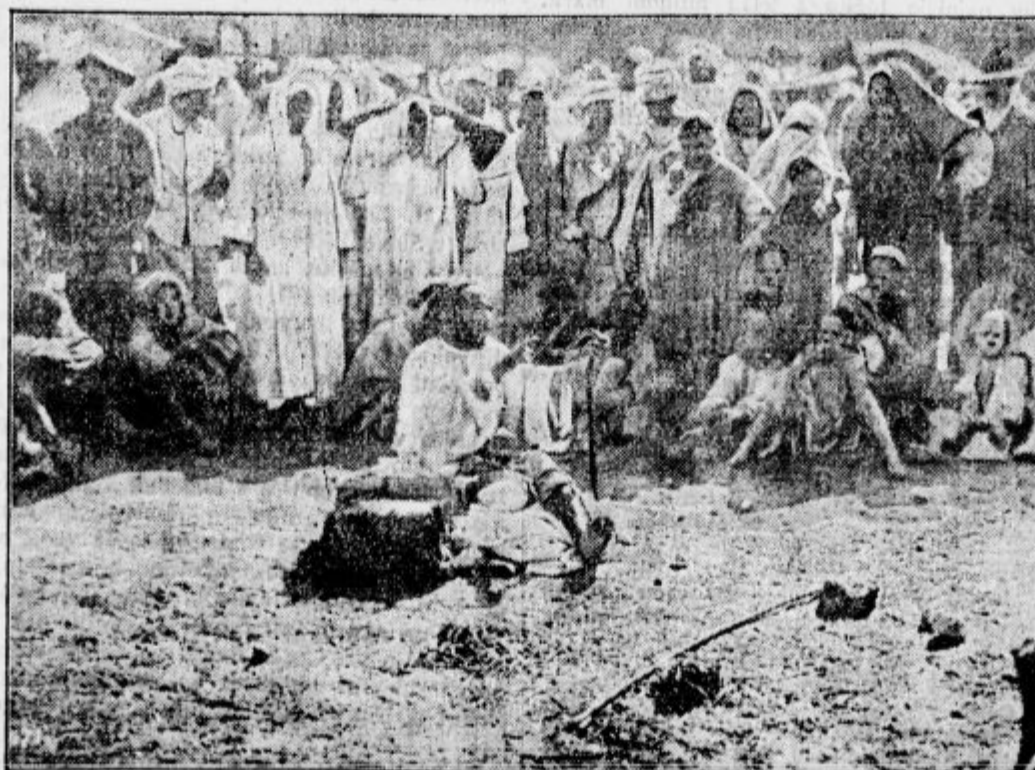
Zivljenje v malem marokanskem mestu v bližini fronte. Ljudje mirno gledajo krotitka kač in njegove umetnosti.

Ilirija jun. : Panonija. Danes ob 14. uri odigrata Panonija in juniorsko moštvo Ilirije na igrišču Ilirije prijateljsko tekmo.