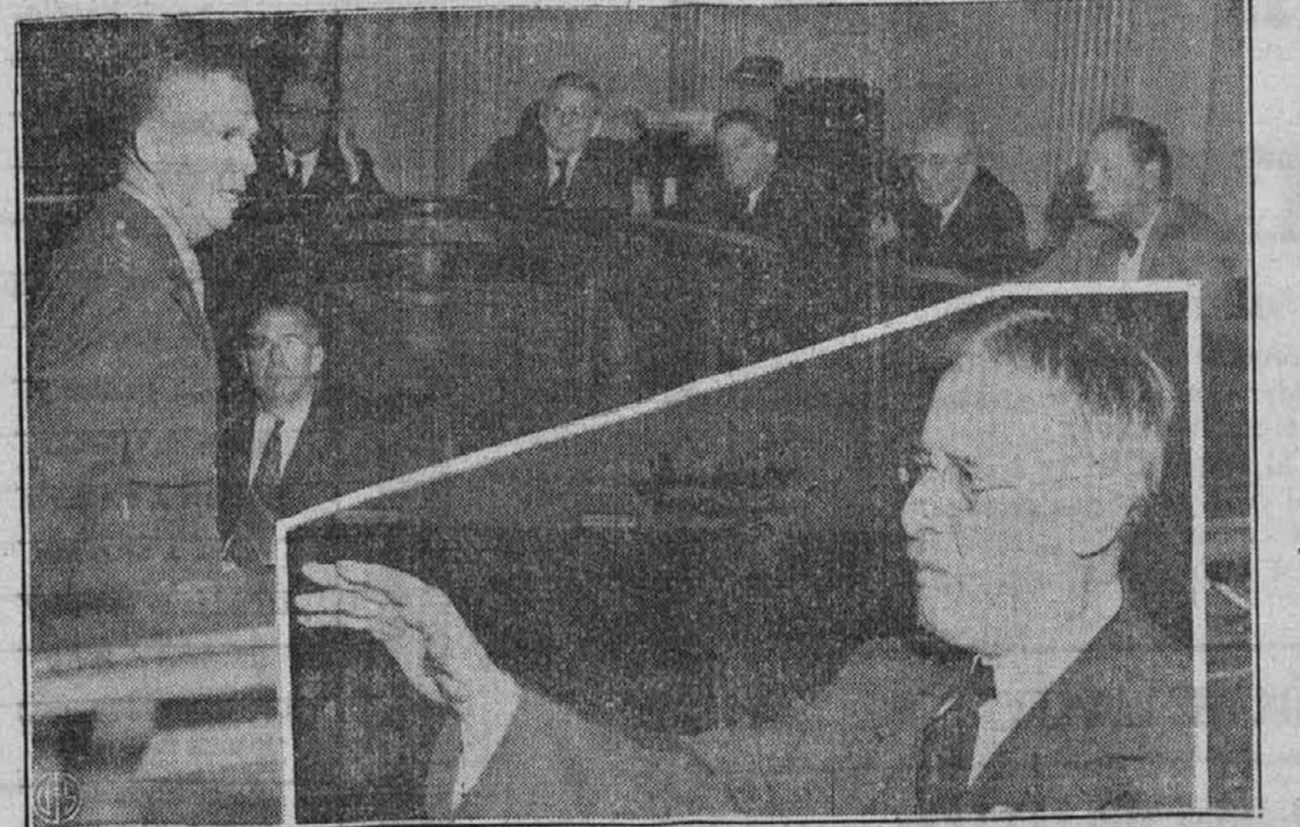
General George C. Marshall, Army Chief of Staff, je nastopil pred senatnim vojnim odborom, kjer je priporočil, da se vpokliče mladeniče z 18 in 19 letom v armado. Senatorji so od leve: Theodor G. Bilbo (Miss.), H. H. Schwartz (Wyo.), Sheridan Downey (Cal.), Elbert D. Thomas (Utah) in Robert R. Reynolds (N. C.). Spodaj na sliki pa pa je vojni tajnik Stimson, ki je rekel, da naša armada postaja prestra.