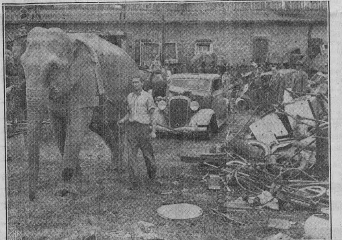
Orjaški ston je sodeloval v paradi za zbiranje starega železa v Norfolk, Va. Ko je prišel v mesto cirkus, je bil isti dan določen za zbiranje starega železa, je bil takoj določen ston, da je prevlačeval stare avtomobile. Slonov prednik je bil pripeljan iz dežele, ki je sedaj zaželjena od osišča.