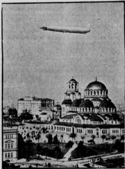
»Groß Zeppelin« nad Sofijo.