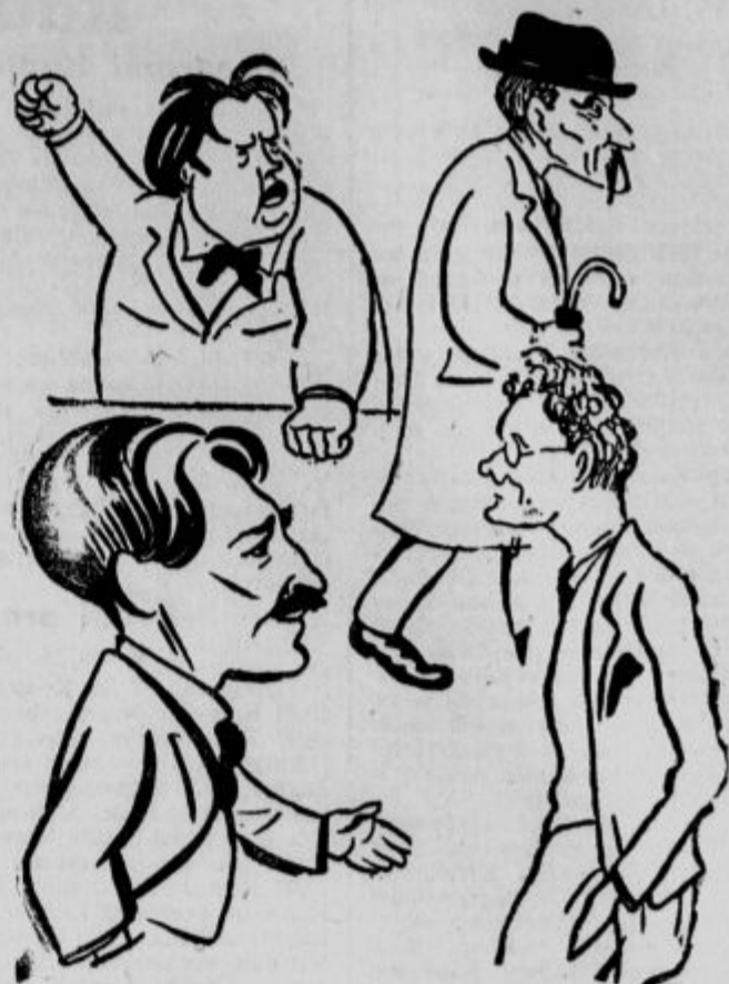
Boj proti komunistom v Franciji. Med 60 komunisti, ki so obtoženi vohunstva in veleizdaje, se nahajajo tudi naslednji štirje imenitni možje, ki nam jih kaže naša slika v karikaturi: Zgoraj Vaillant Coururier, glavni urednik »Humanité«, in Cachin, ravnatelj »Humanité«; spodaj Henry Barbusse, slavni francoski pisatelj, in Doriot, član osrednjega odbora komunistične stranke.