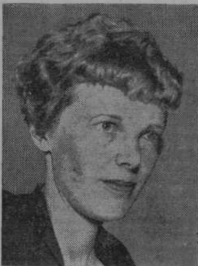
Ameleta Earhart, znana ameriška pilotinja, ki se pripravlja na polet okrog sveta.