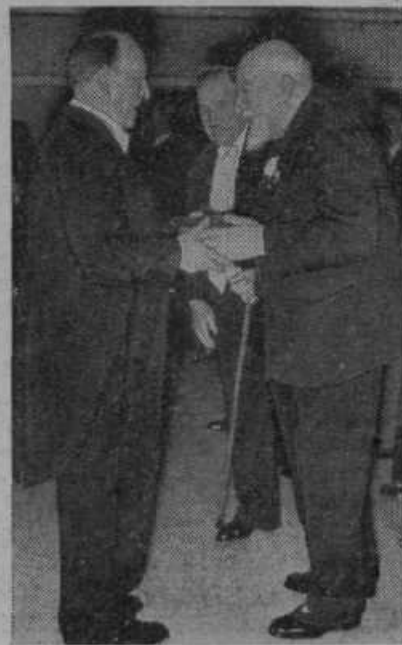
Bivši bolgarski car Ferdinand (levo) na obisku Berlinu.