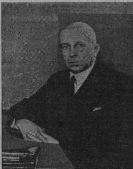
Polkovnik Koc organizira na Poljskem novo državno stranko, ki bo preuredila poljsko javno življenje.