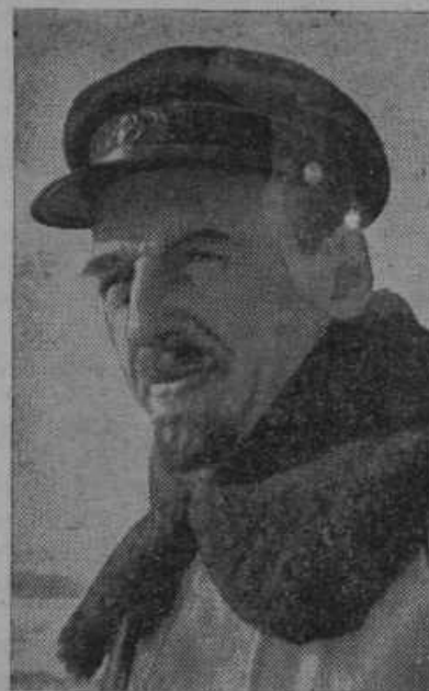
Ruski polarni letalec Farich namerava preleteti 20.000 km dolgo sibirsko obalo preko Irkutska in Jakutska. Na tem poletu bo brzelo njegovo letalo preko pokrajin, kjer je stalno 50 stopinj mraza.