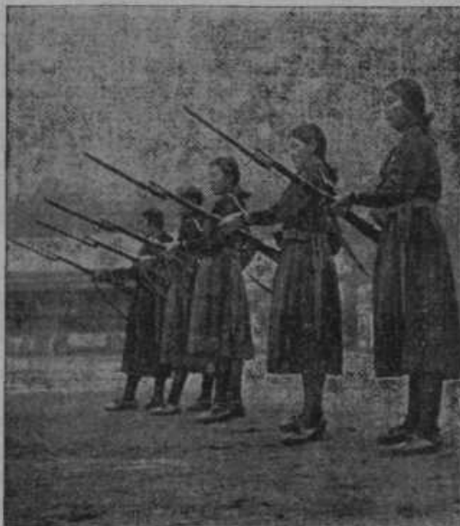
Na Japonskem se vežbajo mladenke v rabi orožja.