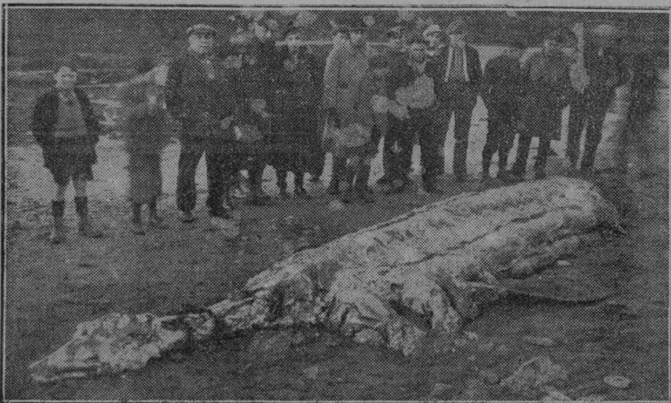
Morje je izvrglo ob francoski obali mrtvo truplo 8 m dolge in povsem neznane morske živali.

Za gospode duhovnike! Imamo posebno knjižico za postni čas »Na Kalvarijo«. Knjiga stane v celoplatno vezana samo 5 Din. Vsakemu g. duhovniku bo dobro služila tudi pri postnih pridigah. Naroča se v Tiskarni sv. Cirila v Mariboru.