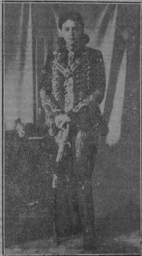
Oton Habsburški, katerega poriva časopisje na avstro-ogrski prestol.