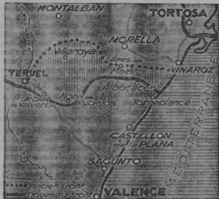
S križci označena črta kaže fronto nacionalistov pred najnovejšo ofenzivo pri Teruelu. Po debeli črti lahko presodimo, koliko so napredovale Francove čete po uspešnih napadih

Celemu svetu je znano, da ne odločujejo glede usode Španije za bodočnost španski