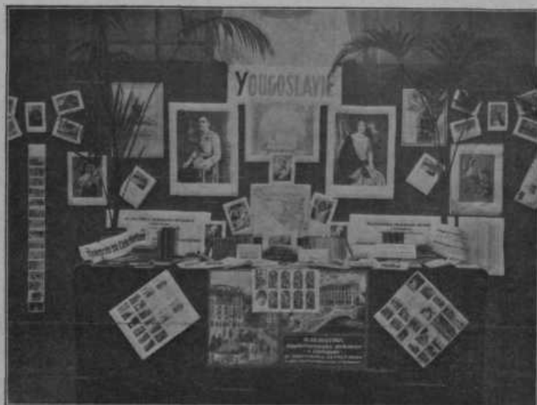
Razstava katoliške tiskovne umetnosti v Bruselu, ki se je je udeležila tudi Tiskarna sv. Cirila v Mariboru.