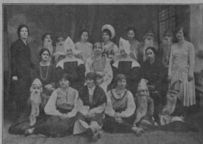
Slovenska dekleta v Zagrebu imajo svojo dekliško zvezo, ki prav živahno deluje. Nedavno je uprizorila igro »Izgubljeni raj«.