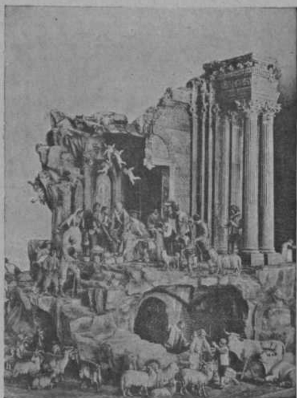
Jaslice v Neapelu na Italijanskem.