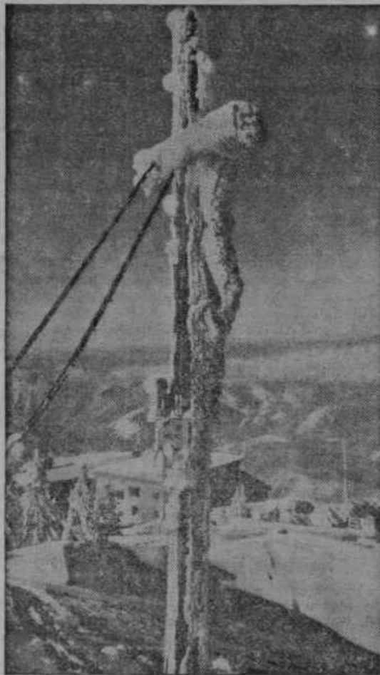
Zasneženi in ožaganelli križ v visokih gorah