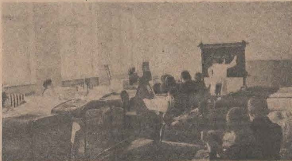
Lekcja dla chorych dzieci w sanatorium na Górcie.

maczyli i melenchole miasta i samobójstwo Bałuckiego malarycznym klimatem okolicy. Była to budka. Żeromski też właśnie fikcyjną sytuację klimatyczną wpakowuje w Cisy. Chałubiński odkrywa klimat zdrowia — Tatr. Ale wkracza do nich bez planu. Nie ubezpieczy górski i nie zabezpieczy uzdrowisk dla mas pracujących. Góralami jest zachwycony. Wydaje mu się, że są oni wytworem klimatu. Ani mu w głowie ich odludniać, uzbroić w oświatę, w postęp techniczny i organizację społeczną na sukcesywne odparcie inwazji kapitalistycznego interesu. Nie przeczuwa tej inwazji, choć sam był właśnie różdżkarzem, który klasom posiadającym odkrył Tatry. Witkiewicz pisał pod koniec wieku XIX, że Chałubiński nie miałby co tu robić „ponieważ to co się z Zakopanem stało, jest bezwzględnie inne niż to, o czym mógł marzyć”. Zabrano góralom powietrze, przemienione w uzdrowiska, wody lecznicze, sanatoria. Nie miały być dla nich, ani dla mas pracujących z nich.