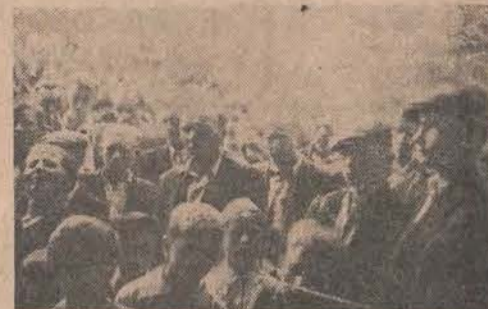
Mieszkańcy Rytwian i okolicy słuchają recytacji poetyckich pisarzy „Wsi”.

Na gruncie ideologii ludowej sprawa pokoleń postawiona została jasno w ubiegłym roku na zjeździe pisarzy „Wsi” w Rytwianach. W prozie, publicystyce i poezji zarysowały się wyraźnie trzy pokolenia. Ich działalność pisarską charakteryzują wielkie różnice w zakresie obejmowanych problemów i umiejętności posługiwania się środkami literackimi. Różnice te wynikły jednak nie tyle z różnych poetyk, z różnic ideologii, bo ta stanowiła pewien ciąg rozwojowy, ale z odmienności zadań, jakie rzeczywistość historyczna przed