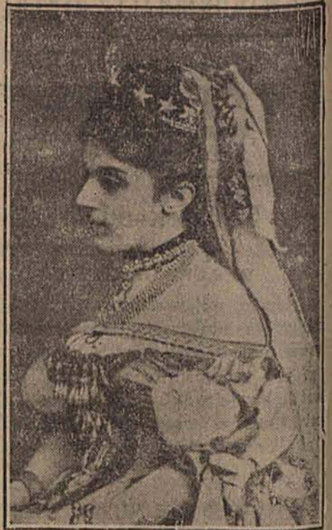
Baronowa Helena Vetsera, matka słynnej baronówny Vetsera, znanej z dramatu na dworze Habsburgów. Baronowa Helena umarła obecnie w Badenji. Była ona swego czasu najpiękniejszą kobietą w Wiedniu.