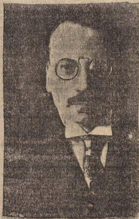
Austrjacki minister finansów dr. Ahrer, który udał się obecnie na pertraktacje finansowe z Ligą narodów.

Węgry — kraj zasobny — który, jak zdawało się jeszcze w zeszłym roku, bez pożyczki zagranicznej wzmocni swój kościec gospodarczy — najwidoczniej dziś utracił nadzieję samodzielnej sanacji i robi bezskuteczne starania o pożyczkę.