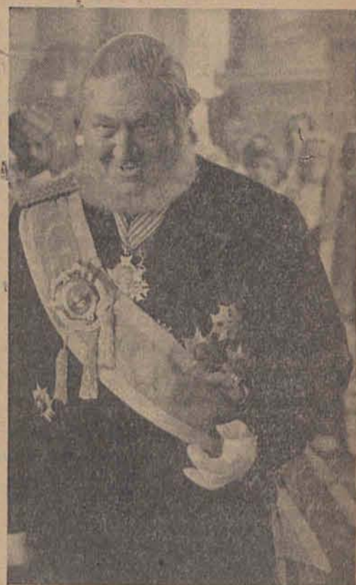
Ohm Krüger antwortet lächelnd auf die englischen Begrüßungsworte

er zum Vizefeldbarnett gewählt, kurz darauf zum Friedensrichter. Waren das schon Zeichen dafür, daß seine Rebllichkeit und Gerechtigkeit bei den Buren geschätzt wurden, so spricht die Ernennung des kaum 38jährigen zum Generalkommandanten der Transvaal-Republik für das große Vertrauen, das seine Buren in ihn setzten. Sein Weg wurde bestimmt von dem starken