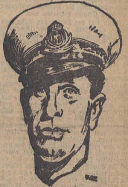
Der Herzog von Aosta

Es ist jetzt fast ein Jahr seit jenem denkwürdigen Tag verstrichen, an dem der Duce vom historischen Balkon in Rom den Kriegseintritt Italiens verkündete. Damals konnte sich die gegnerische Propaganda nicht genug darin tun, den nahen Zusammenbruch des italienischen Kolonialreiches in allerlärzester Frist zu prophezeien. Wenn wir heute, 12 Monate später, eine Bilanz des Widerstandes aufstellen, den die italienischen Kolonialtruppen im Norden wie im Osten Afrikas einem vielfach überlegenen Feinde gegenüber geleistet haben, und außerdem die schwierige strategische