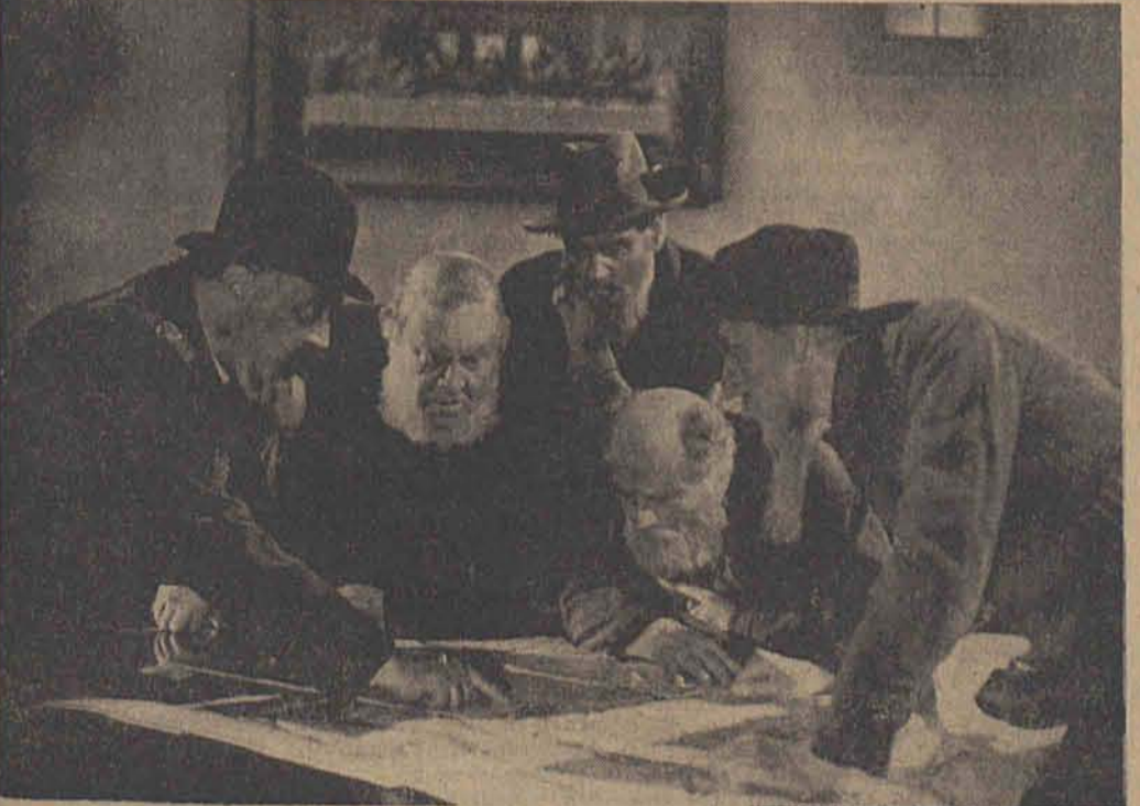
Kriegsrat bei Ohm Krüger