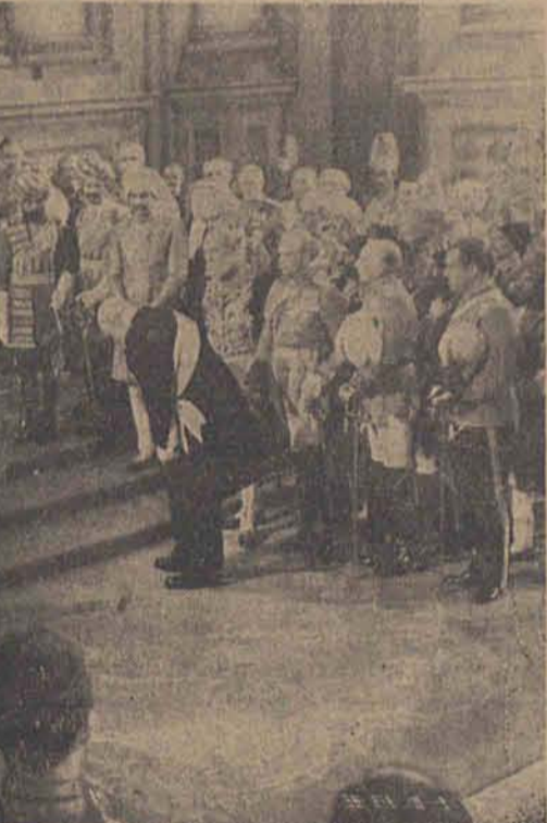
Ohm Krüger vor der Königin von England im Buckinghampalast