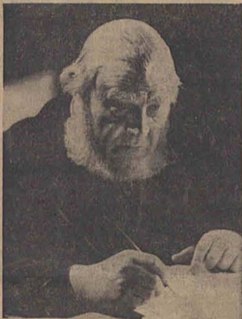
Der Burenpräsident Ohm Krüger (Staatsschauspieler Emil Jannings)

Durch die niederträchtige Methode, Eingeborenensämme gegen die Republik zum Aufstand aufzustacheln und Truppen für einen groß-