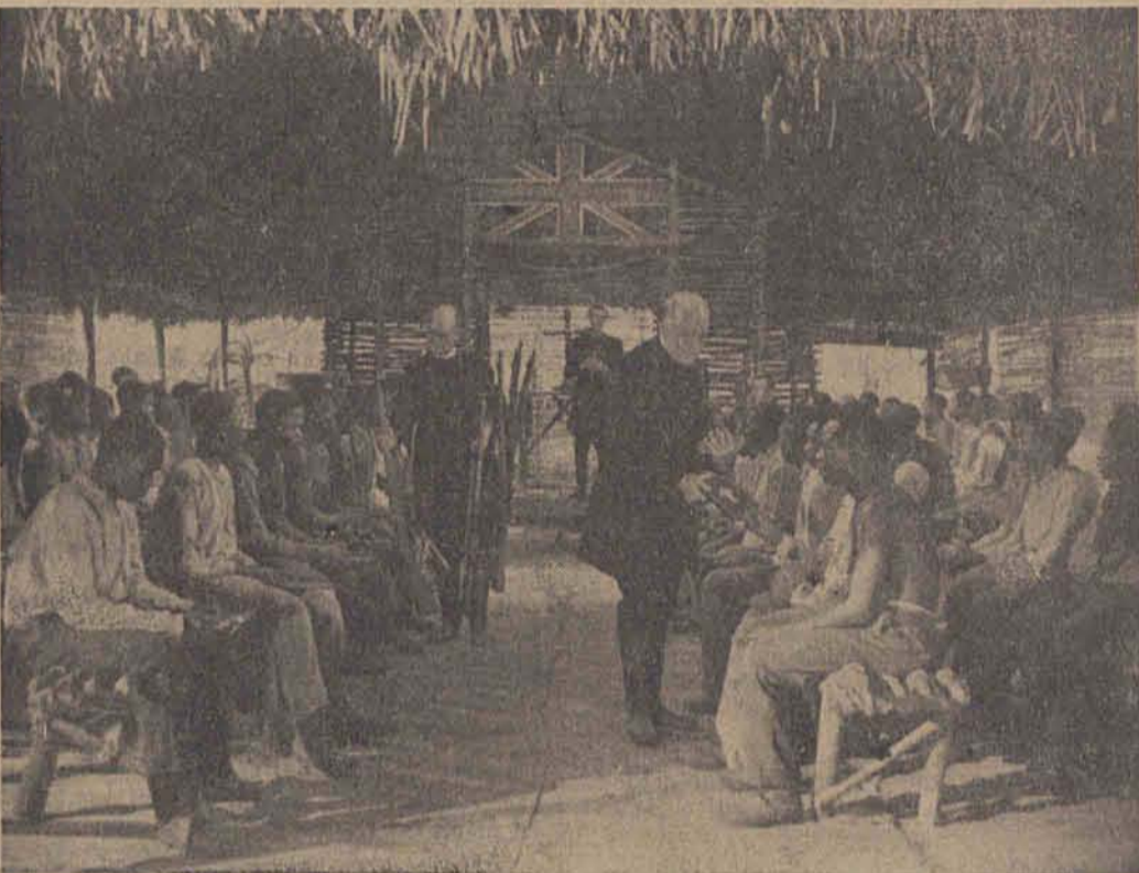
Englische Missionare verteilen Gewehre und Gebetbücher an die Eingeborenen

Wille unseres Herrgotts sein, daß ein ganzes Volk in Sklaverei leben soll. Deshalb zogen wir tiefer in das Innere Afrikas und suchten neue