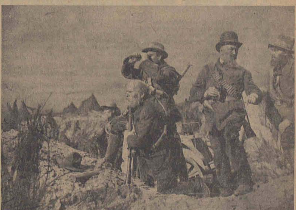
Die Schlacht gegen die Engländer ist im Gange