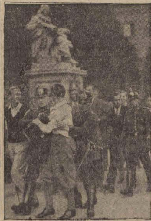
Policja likwiduje demonstrację studentów.