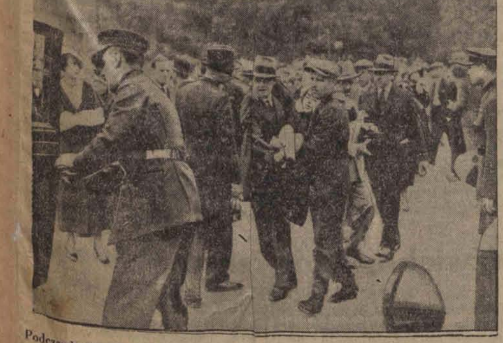
Podczas konkursu samochodowego w La Boulońskim pod Paryżem wydarzył się straszny wypadek. Zona dyplomaty paskiego, kierując odznaczonym samochodem, wpadła w tłum widzów przy wymijaniu przeskody. Kilka osób zostało ciężko poranionych. — Na zdjęciu przenoszenie rannych do auta.