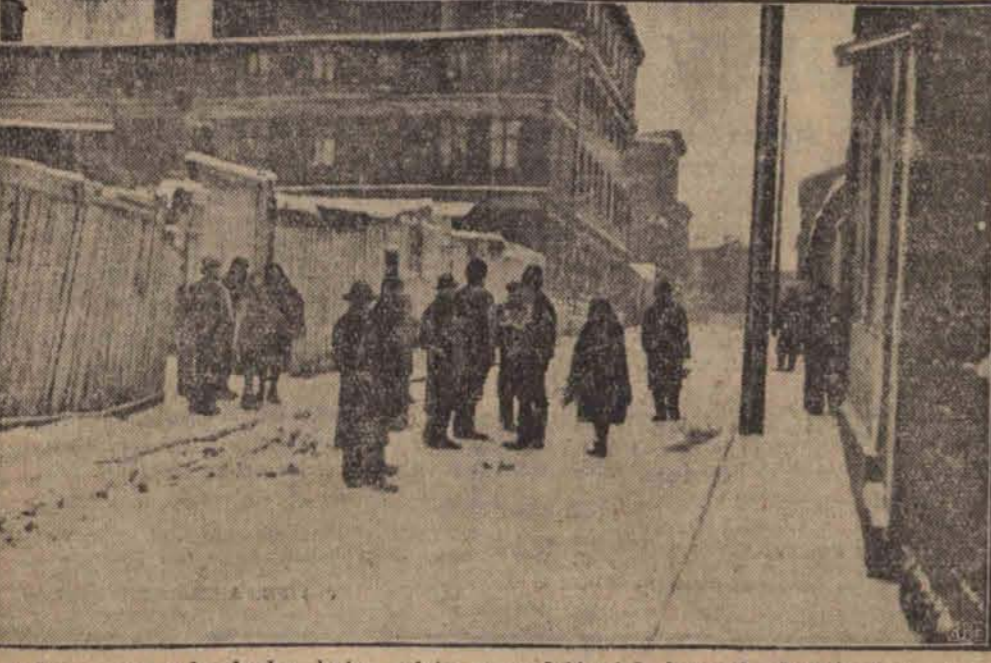
Na rzekomo straszły duchy, które miały wyrządzić wiele krzywd odwiedzającym w pa- laisławie Bogaczykównę. Między innymi najbardziej poszkodowały na... umyśle — kilka- -tłośkarzy, którzy gwałtem zapragnęli prze- razić łódzian strachami.