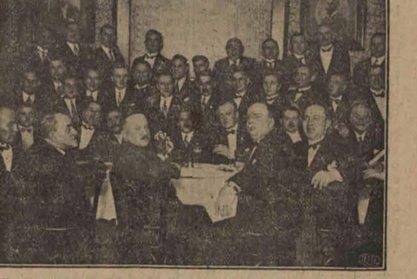
W ubiegłą sobotę towarzystwo sportowe Union obchodziło 30-lecie swego istnienia.