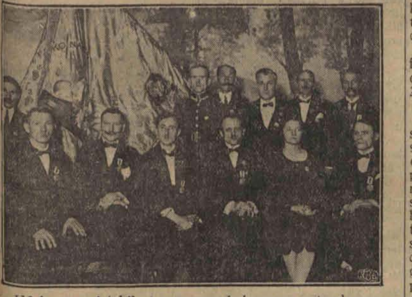
Udekorowani jubileci z nowopoświęconym sztandarem.