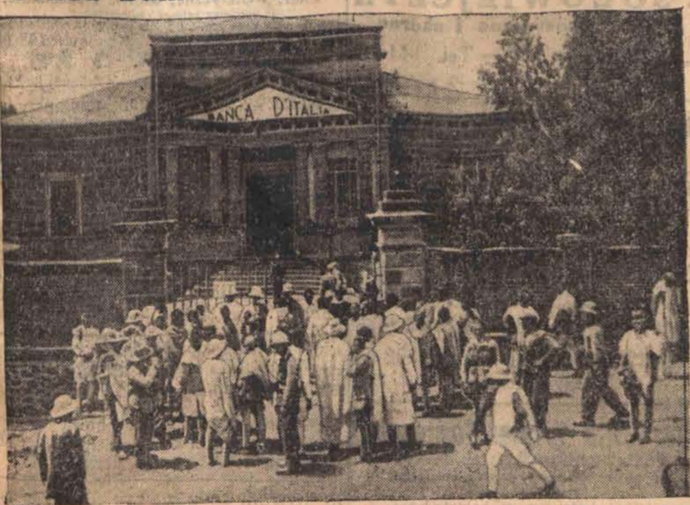
Tubylcy stoją w ogonku przed wejściem do Banku Włoskiego w Addis Abebie, gdzie wymieniają swe talary na włoskie liry