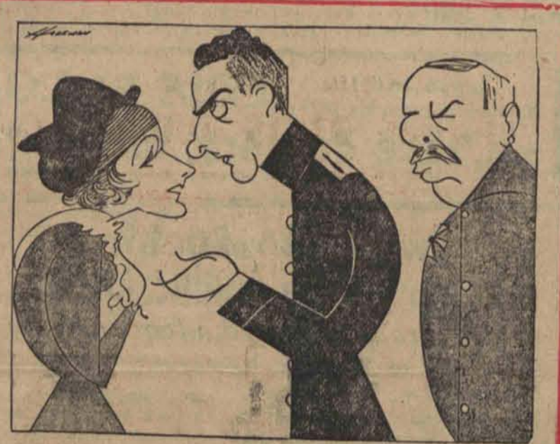
Ołówek znanego karykaturzysty amerykańskiego nie oszczędził również najpiękniejszej pary artystów filmowych, Grety Garbo i Johna Gilberta, znanych w Łodzi z filmów „Symfonia Zmysłów” i „Anna Karenina”.

Poza tem wiadomo ogólnie, że cały szereg chorób zaraźliwych dostaje się do organizmu przez usta. Powstają w ten sposób angina, ostry reumatyzm stawów, choroby wysypkowe (odra, szkarlatyna itd.) Sezonowe warunki klimatyczne sprzyjają rozwojowi tych chorób, dla ustrzeżenia się od