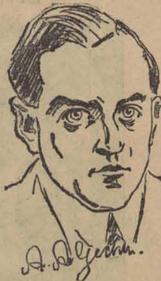
Dr. Aljechin, synny szachista w tych dniach przybędzie do Łodzi. (H)