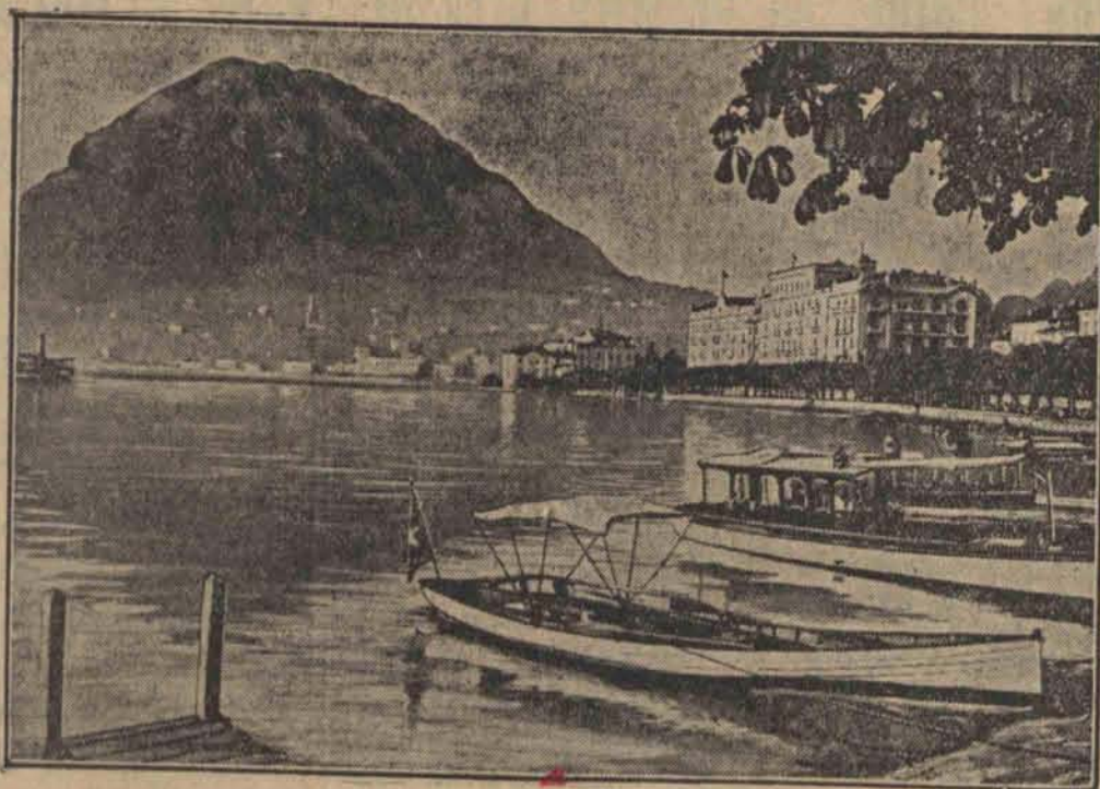
Wybrzeże w Lugano, zaroi się dnia 10 grudnia od dyplomatów i dziennikarzy, którzy tu zjadą na sesję Rady Ligi Narodów.