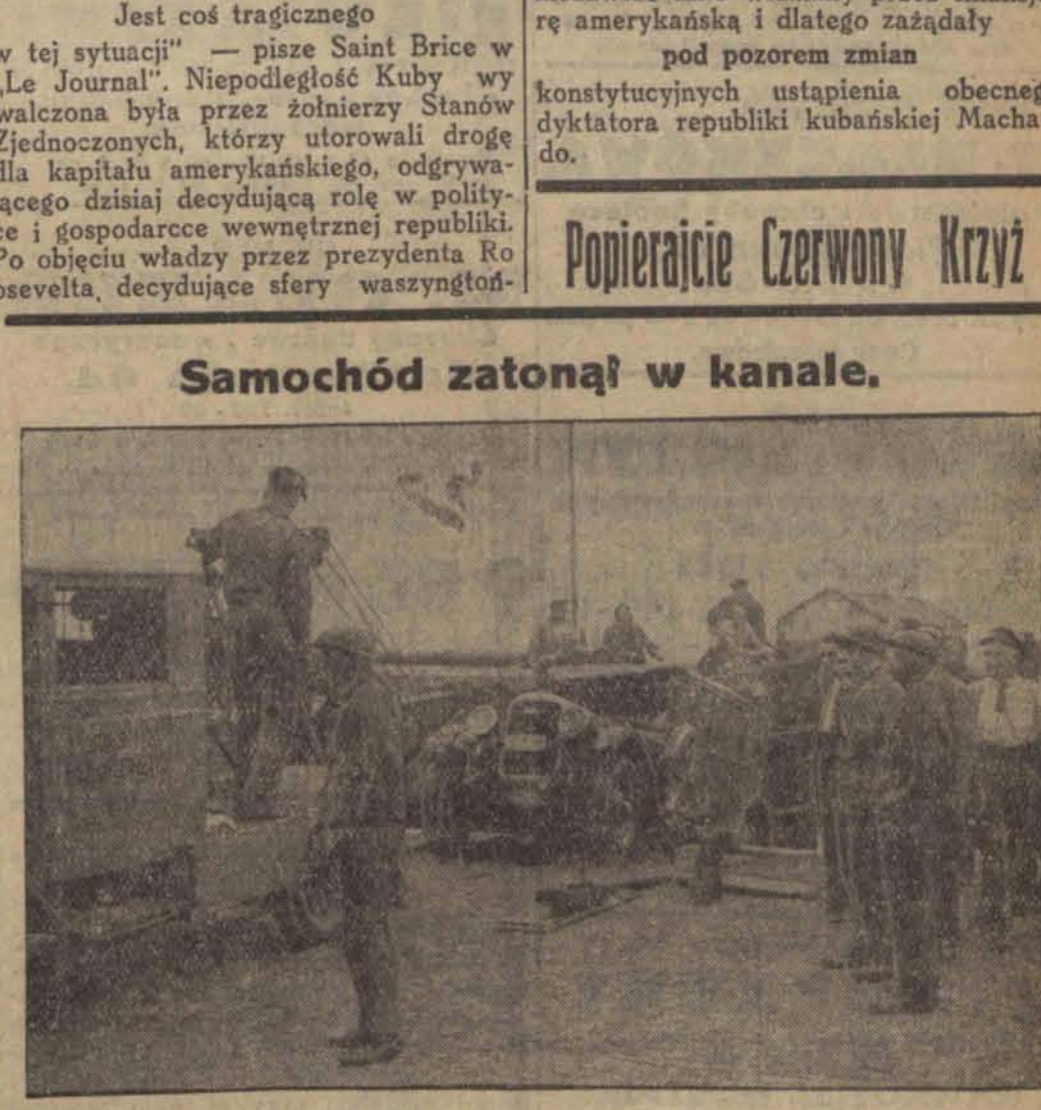
W miejscowości Purmerend (Holandia) wydarzyło się niezwykle nieszczęście Pędzący samochód wskutek zepsucia się hamulców wjechał całym pędem na barierę i spadł do głębokiego kanału. Na ilustracji: wydobywanie samochodu z 7 trupami we wnętrzu.