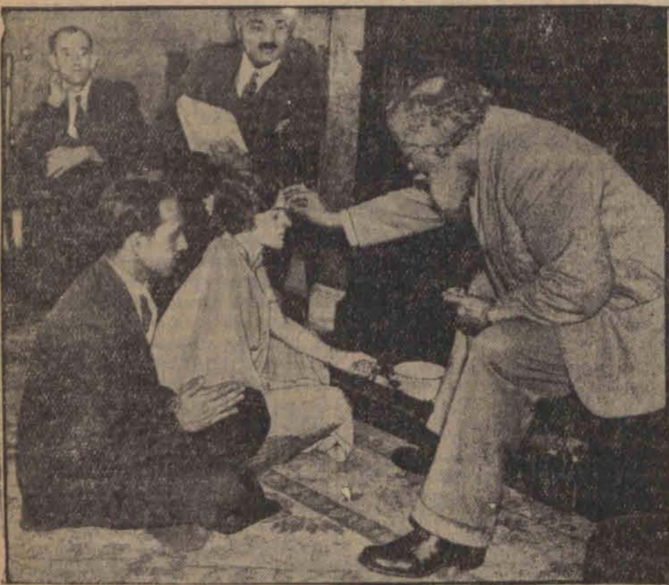
W Anglii wydarzył się rzadki wypadek przyjęcia bramanizmu przez młodą arystokratkę, zaręczoną z hinduskim milionerem. Na ilustracji widzimy kaptana hinduskiego, malującego czerwony znak kasty na czole panny młodej.