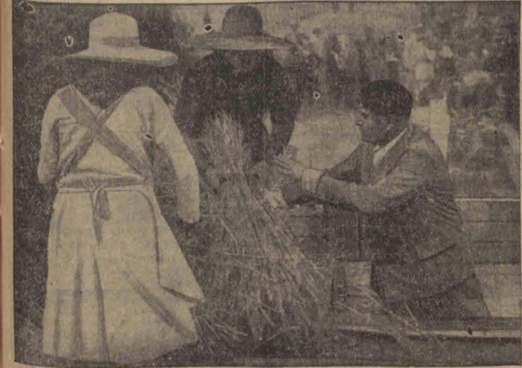
Mussolini pomaga zebrać pierwsze sno py pszenicy, która wyrosła na wysu- szonych na jego rozkaz Błotach Pontyjskich.