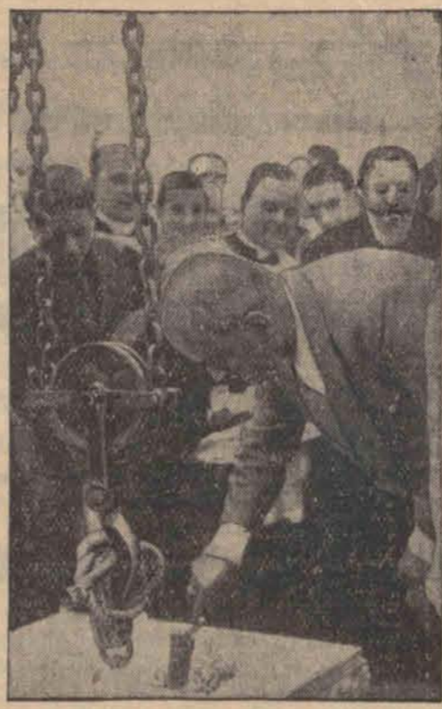
Mussolini zakłada kamień węgielny pod nowe miasto Sabaudia które powstanie na osuszonych błotach Pontyjskich.