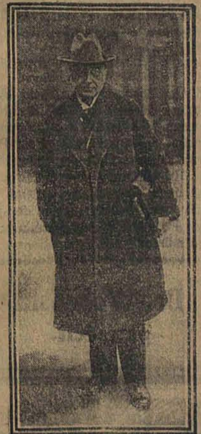
Niemiecki minister spraw zagranicznych dr. Stresemann, przewodniczący delegacji niemieckiej w Genewie.

Wszystkie dzienniki gdańskie podkreślają zgodnie, że wczorajszy dzień w Genewie ujawnił konieczność zmiany traktatu wersalskiego, albowiem Wersal nie da się pogodzić z Genewą