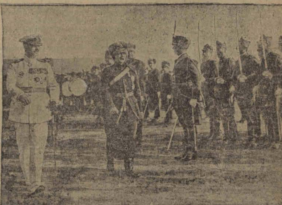
Królowa Jugosławińska Marja przechodzi w mundurze pułkownika przed frontem rumuńskim, który nosi jej nazwa. Obok niej kroczy jej brat, król rumuński Karol II.