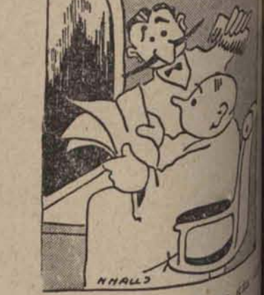
— Czy mam pana uczesać na głowę? —