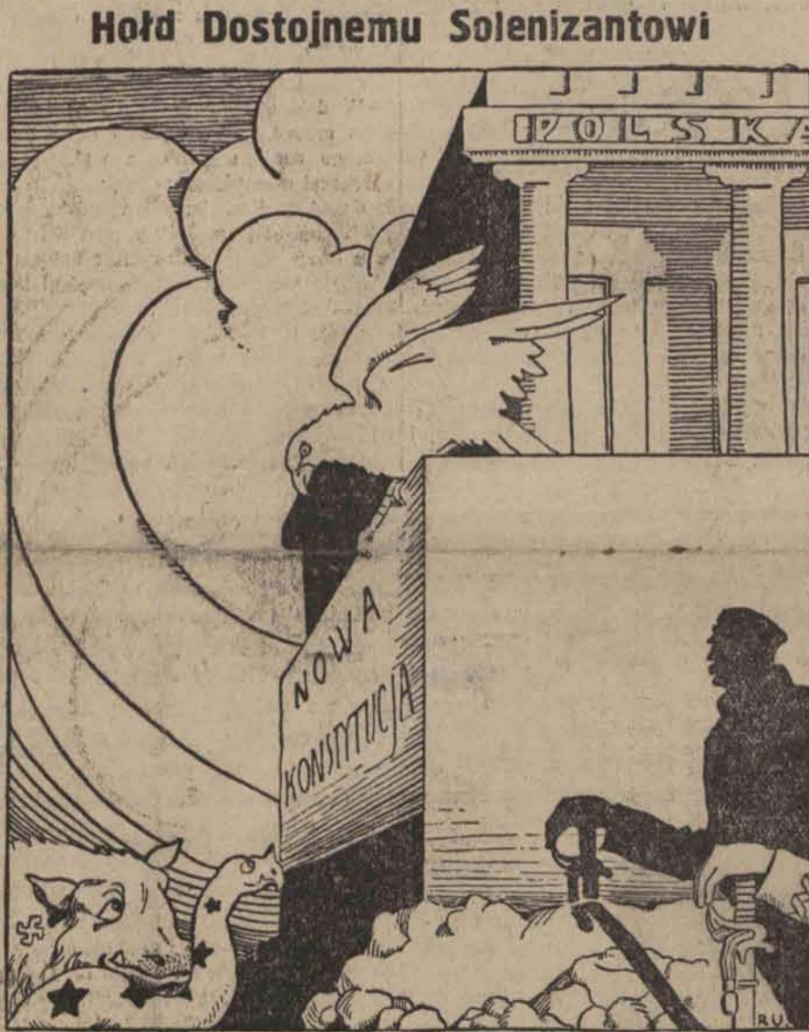
Wielkiemu Budowniczymu mocarnej Polski składa w dniu dzisiejszym całe społeczeństwo.

Mimo gorączki samopoczucie marszał- ka było zupełnie dobre. Influenza trwa- ła krótko i marszałek Piłsudski ponow- nie zabrał się do przerwanej pracy nad swoim dziełem.