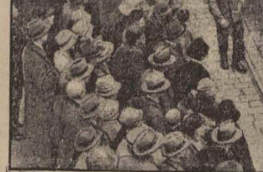
W mieście turyngkim Eisenach od setek lat odbywa się ku uciesze tłumów wędrowka symbolicznej gąsienicy na powitanie wiosny.

Gimnastyka oddechowa rozwija piękna i normalną budowę ciała. Jedną postawę, harmonijność kształtów, a poza tom: energje, silę woli i charakteru, śmiałość, odwagę oraz przyłmność umysłu. Kształcąc zaś ciało i ducha, daje jednocześnie radość życia, ucząc, że: po mimo panującego na całym świecie kryzysu ekonomicznego — życie jednak jest piękne.