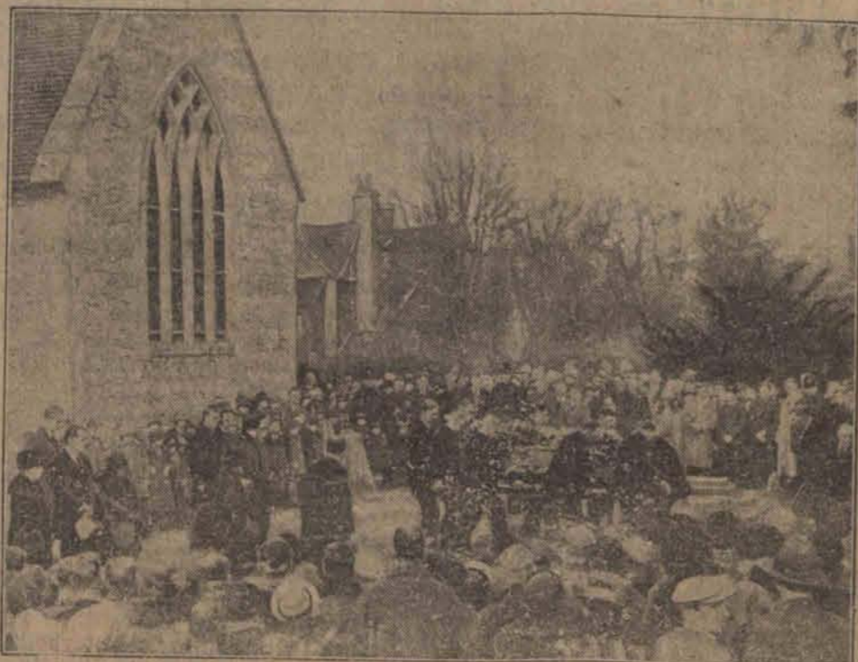
Skromny pogrzeb wielkiego męża stanu i wielokrotnego premiera Wielkiej Brytanii w miejscowości rodzinnej Sutton Courtenay.

proces Pangalosa dzia w Grecji nadzw ne zainteresowanie.