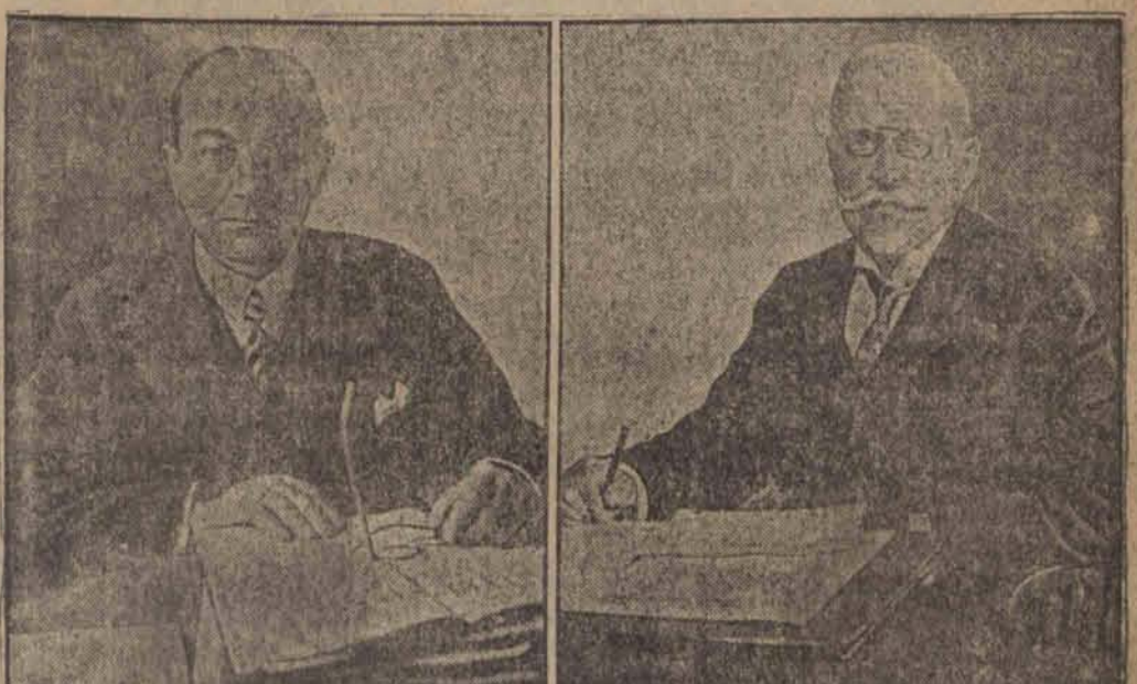
Dr. Curtius — minister spraw zagranicznych Rzeszy i dr. Schober — austriacki minister spraw zagranicznych i wicekanclerz podczas podpisywania umowy o unji celnej, która wywołała olbrzymie wrażenie w całej Europie, jako pierwsze naruszenie istniejących traktatów pokojowych.