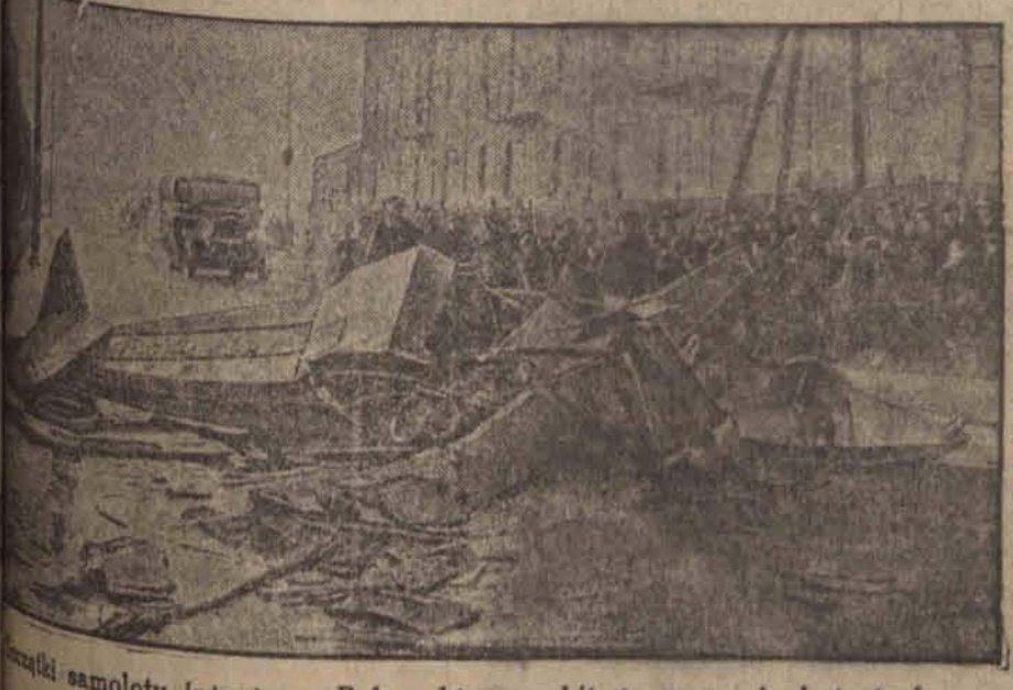
Zmieszkał samolot inżyniera Puławskiego, zabitego w czasie katastrofy. — Dwa przechodnie odnieśli ciężkie rany.