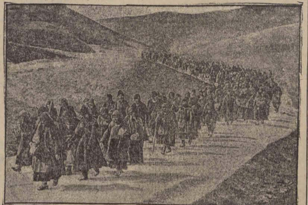
Pielgrzymka włościan bałkańskich w drodze do Jerozolimy.