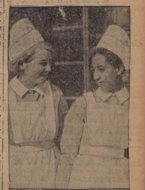
16-letnia księżniczka Tsahai wstąpiła do szkoły pielęgniarek dzieci przy szpitalu Great Ormond w Londynie.