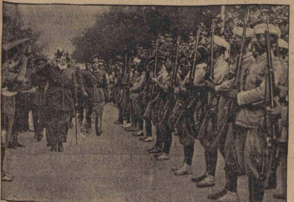
Do Burgos głównej kwatery powstańców na północy, przybyły pierwsze oddziały marokańczyków. Przed frontem przechodzi szef rządu powstańczego gen. Cabanellas