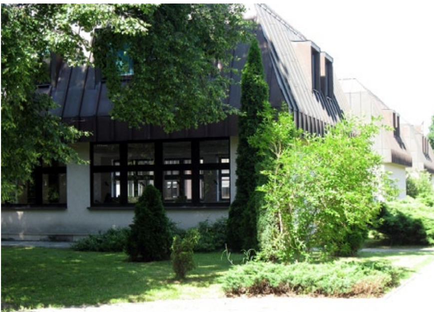
Gmach Biblioteki na Bielana