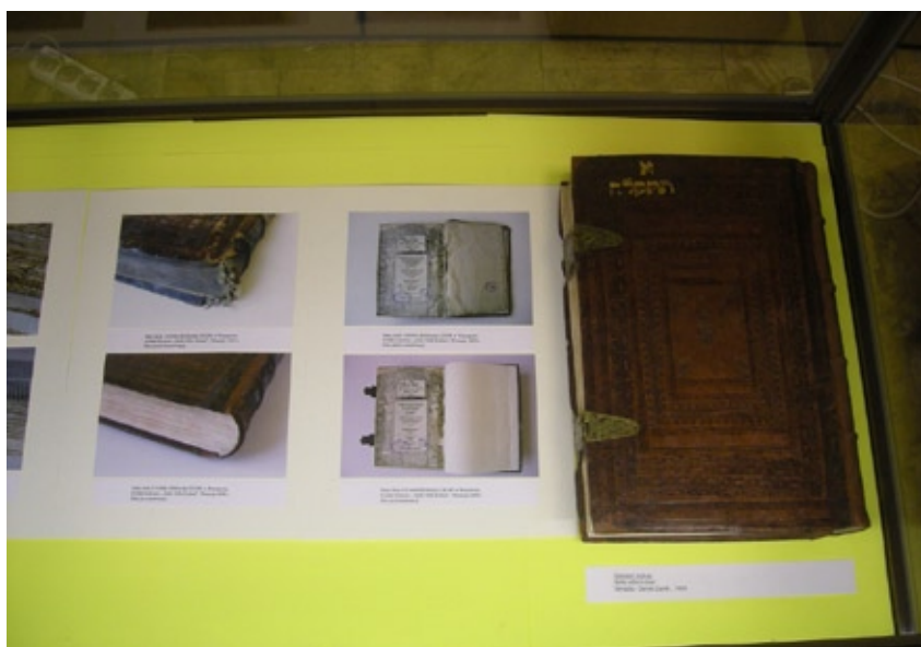
Wystawa starych druków po konserwacji