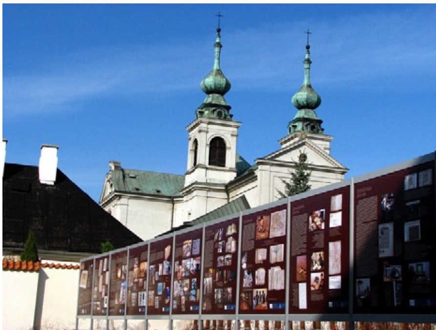
Wystawa pt. Ochrona i konserwacja cieszyńskiego dziedzictwa piśmienniczego