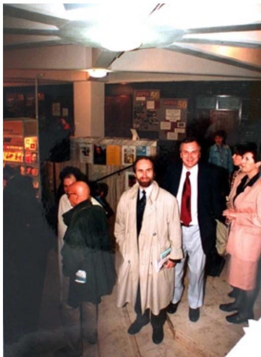
III Targi Wydawców Katolickich, Warszawa – Stegny (1998)

W dalszej perspektywie, związanej z powstaniem nowego gmachu, Biblioteka UKSW pragnie rozwijać się jako centrum edukacji, informacji i kultury, w którym dbałość o chrześcijańskie dziedzictwo kultury europejskiej łączyć się będzie z wykorzystaniem najnowocześniejszych form realizacji przekazu wiedzy i informacji.