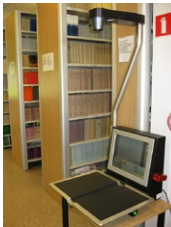
Skaner w Czytelni Główniej