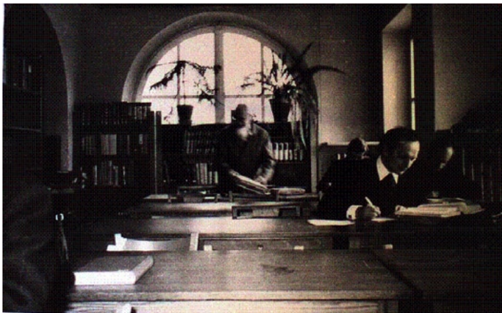
Czytelnia Główna ATK

Za czasów ATK w Bibliotece Głównej funkcjonowały katalogi: alfabetyczny, przedmiotowy, podręczników, rozpraw doktorskich prac magisterskich i rękopisów, oraz