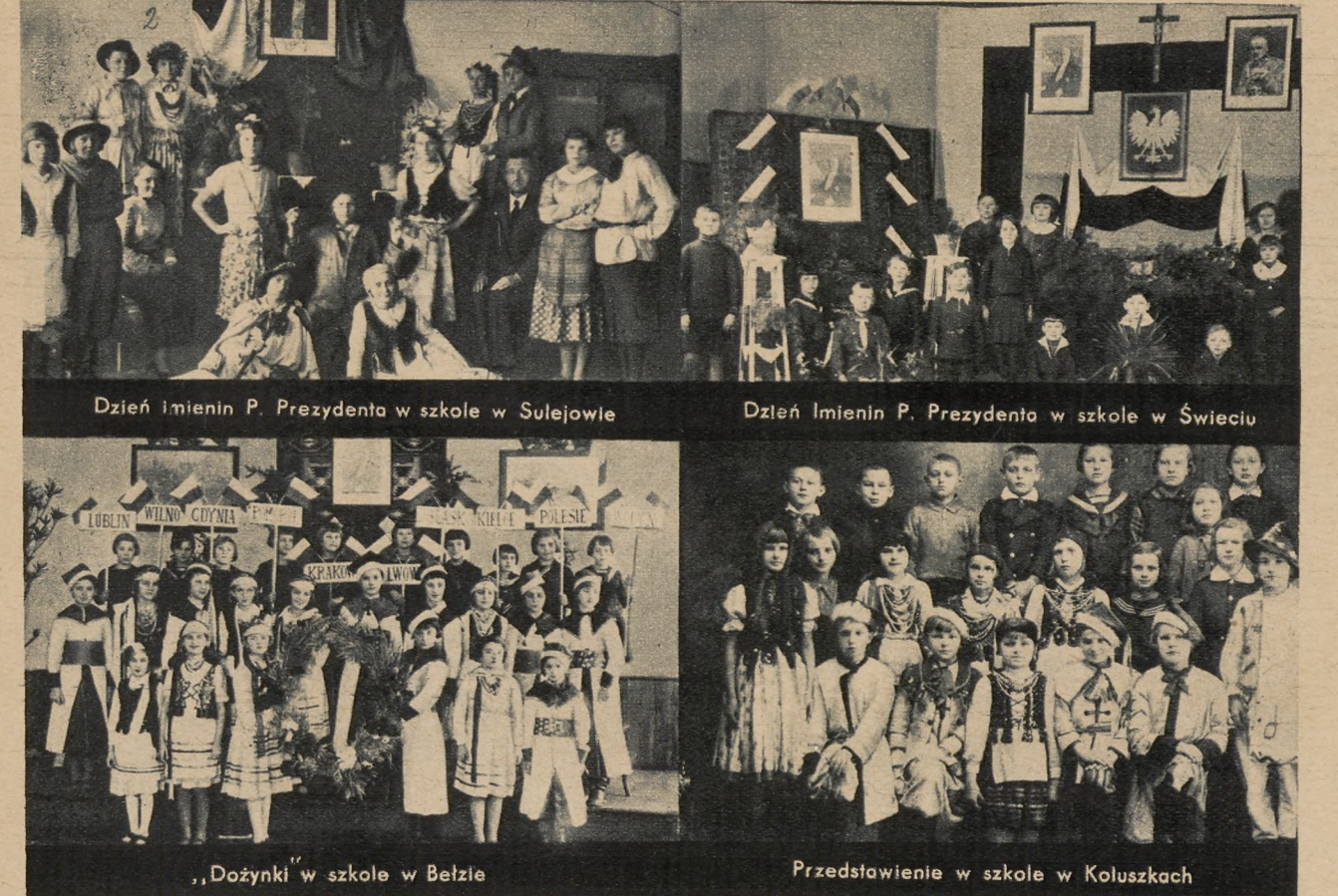
Dzień Imienin P. Prezydenta w szkole w Sulejowie