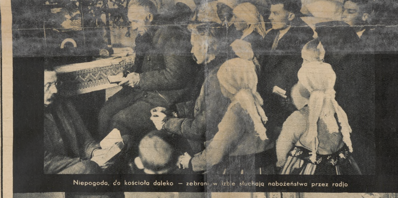
Niepogoda, co ksiocioski dokoła — zebrał w wieś słuchając nabożeństwa przez radio