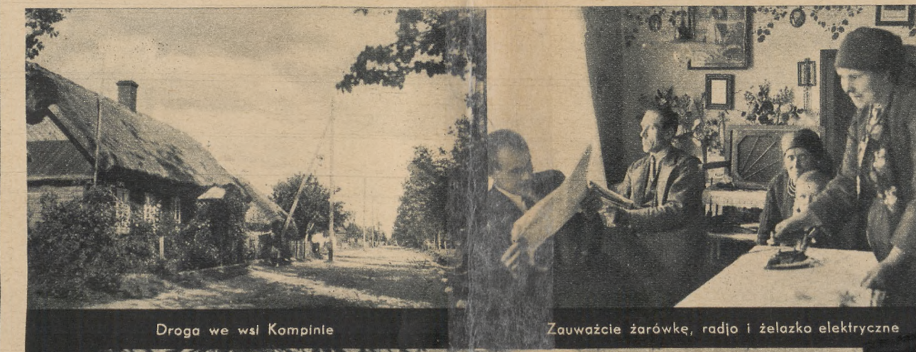
Druga wól Kompina