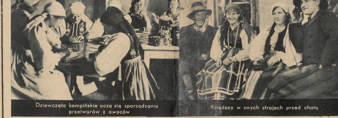
Dzieci w Kompinie uczą się sporządzenia przetworów z owoców