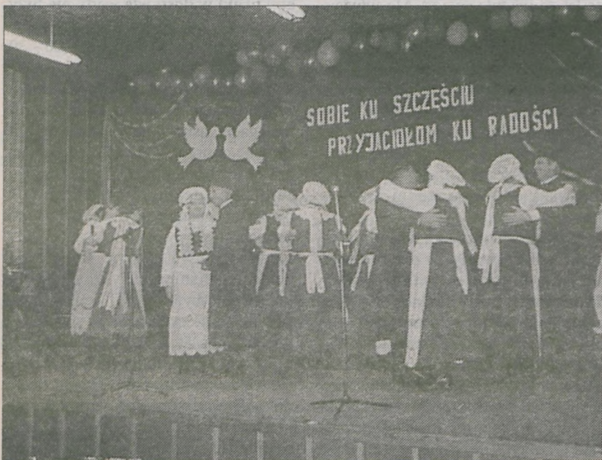
Występ zespołu ludowego „Golinianka” uświetnił wigilijny wieczór.