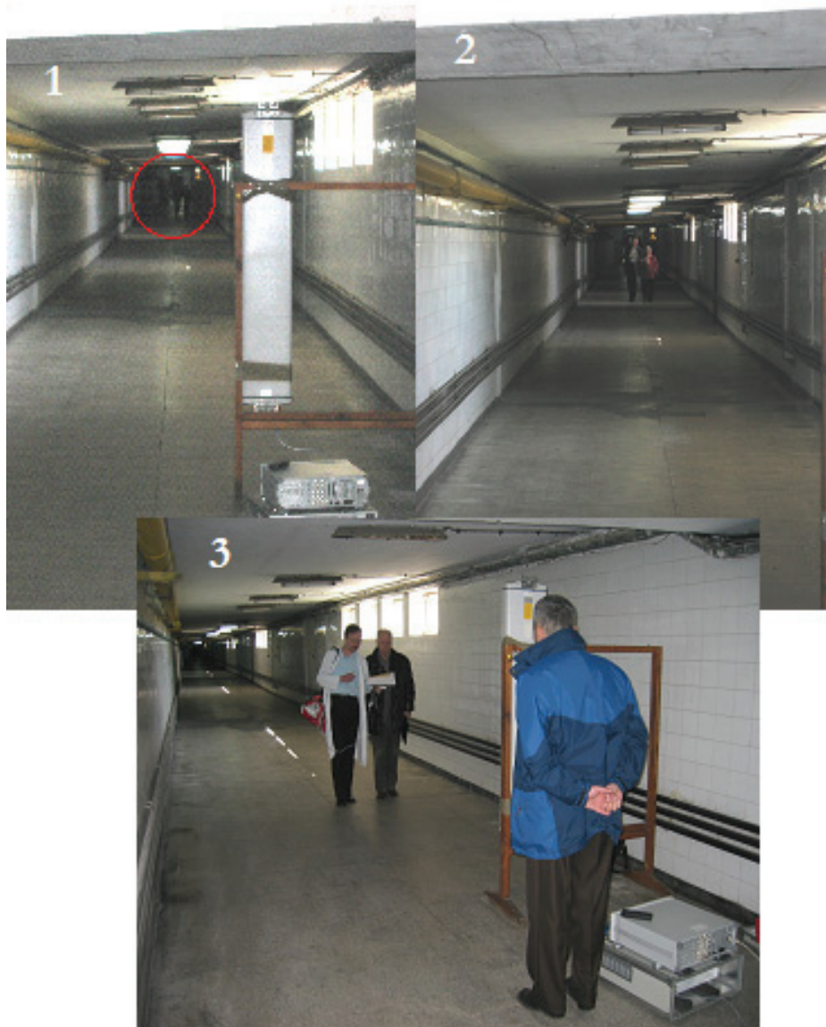
Rysunek 1. Pole badawcze – korytarz pod budynkiem „A” Szpitala Klinicznego przy ul. Banacha w Warszawie: (1) Lekarz z pacjentem na początku pola badawczego. (2) Lekarz z pacjentką przemieszcza się w kierunku anteny stacji bazowej. (3) Lekarz z pacjentem zatrzymuje się na linii wskazującej kolejny poziom natężenia pola elektromagnetycznego.