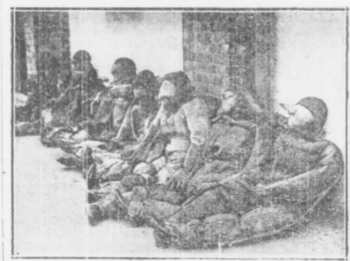
Ten rząd bezwzględnych postaci to nie ofiary jakiegoś katalizmu, lecz zwyciężające labli, używane do wyrobowywania nowych spadochronów.