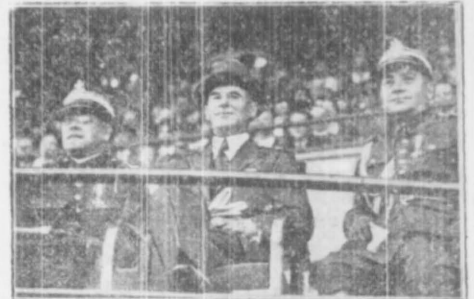
Na meczu między reprezentacją piłkarską Polski a czołową Jaryżną zawodowej ligi angielskiej "Chelsea" w Warszawie obecny był Wódz Naczelny gen. Śmigły - Rydz (w ubraniu cywilnym).