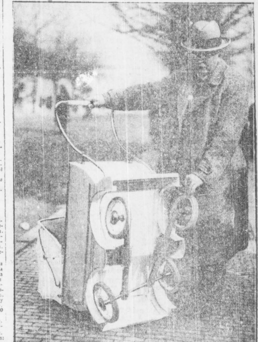
Orygnalny wózek dziecinny, którego przednie koła są wrotne tak jak w samochodzie, przez co ułatwione jest kierowanie wozkiem.