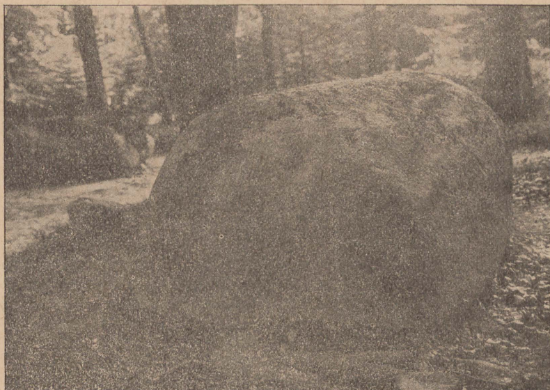
Mäpfchenstein beim Schloßwall Werder. (Text Seite 58).

M ö n c h, waldiges Ufer im Fagen 135; es liegt zwischen Kollicker Ufer und Wese.