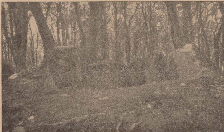
Der Pfennigkassen. (Text Seite 59).