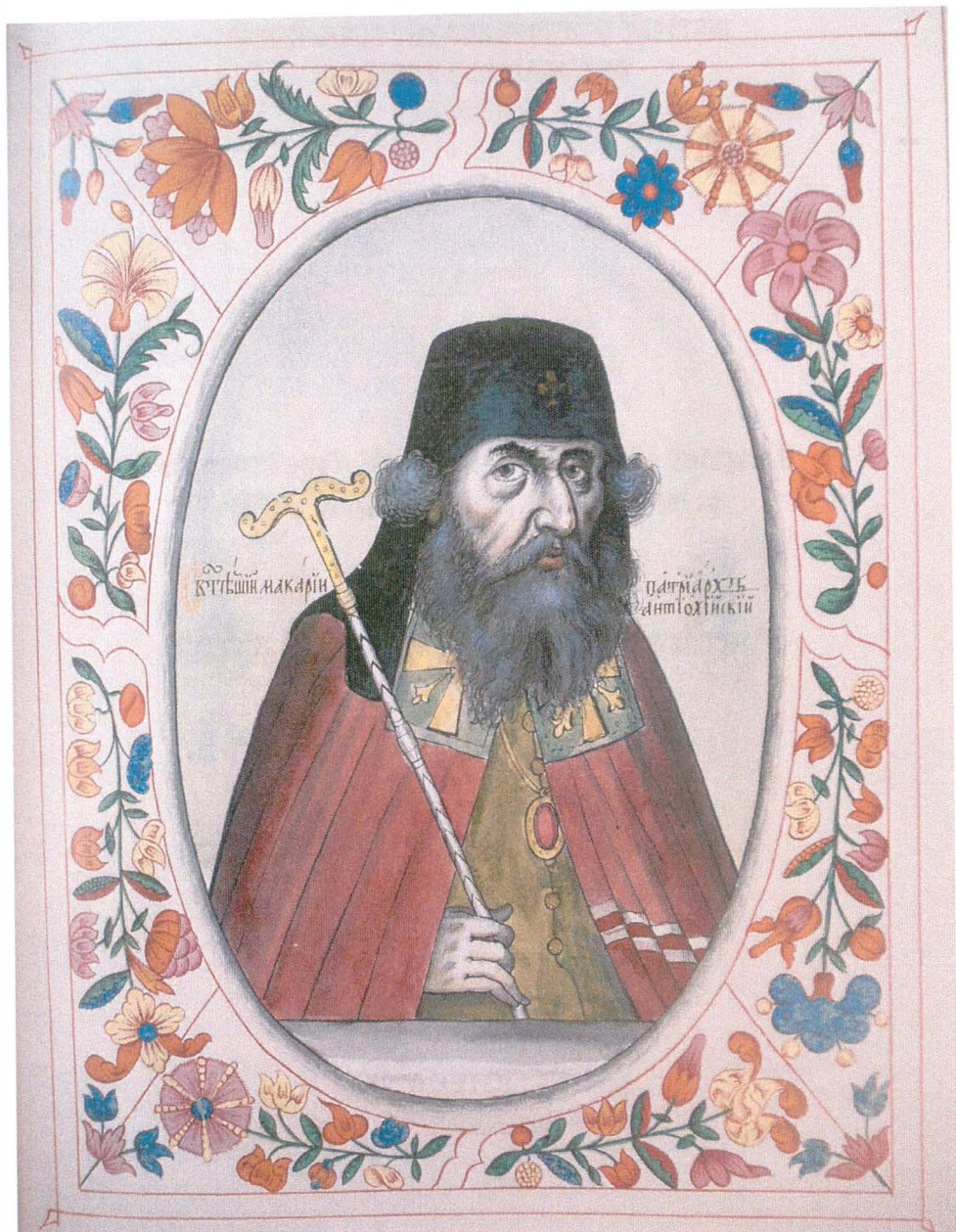
Portrait du Patriarche Macaire III dans Tsarskij Tituljarnik , manuscrit de 1672, conservé à RGADA, Moscou, Fonds 135, P. V, Rubr. III, no. 7, fol. 85r.