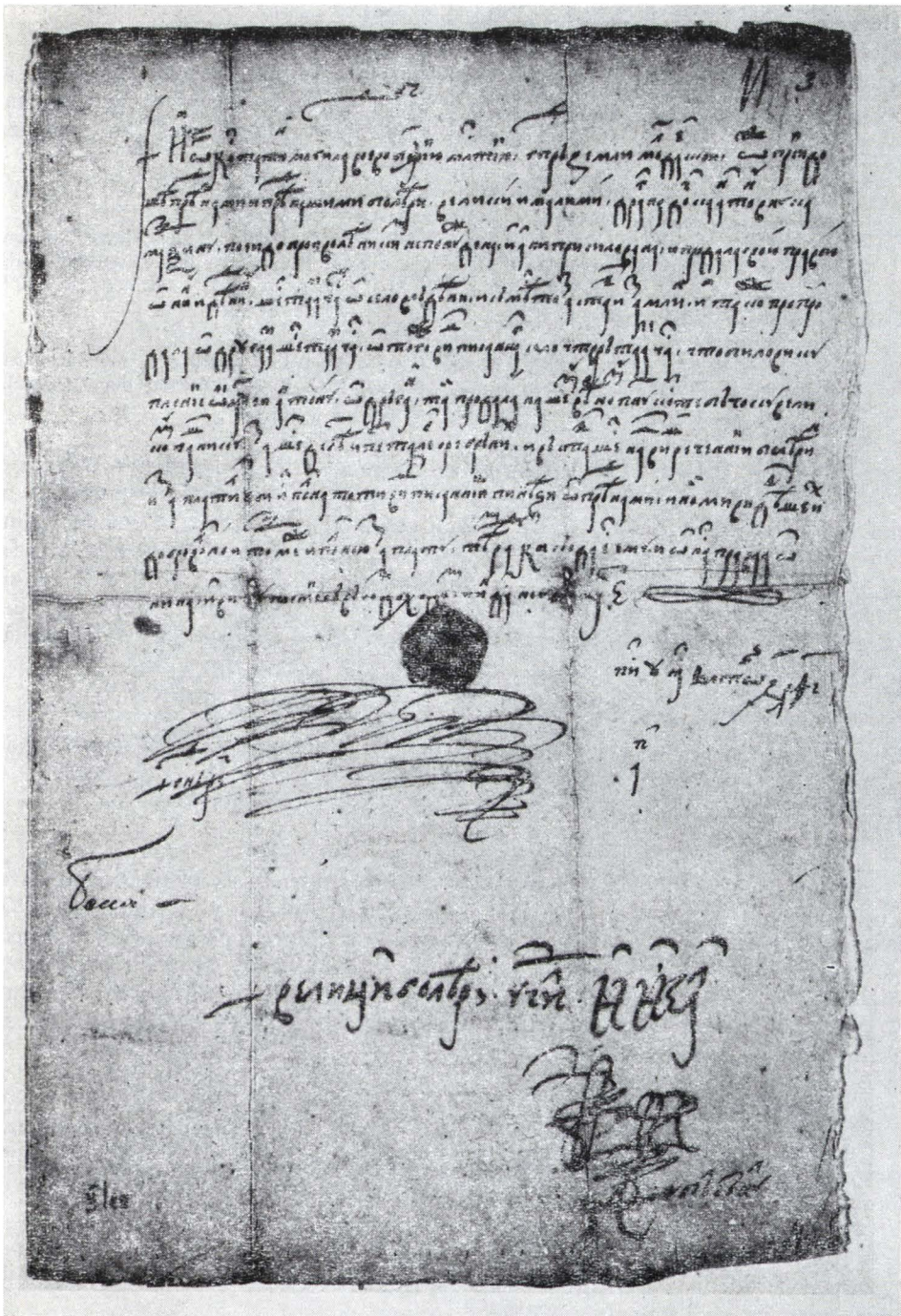
9. 1611 (7119) apr. f.z., Iași. (Rez. nr. 286)