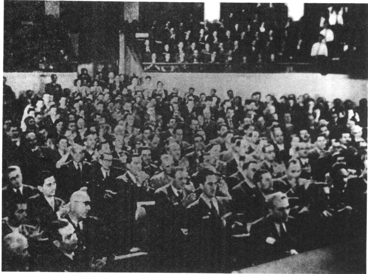
Lucrările Congresului Partidului Social-Democrat