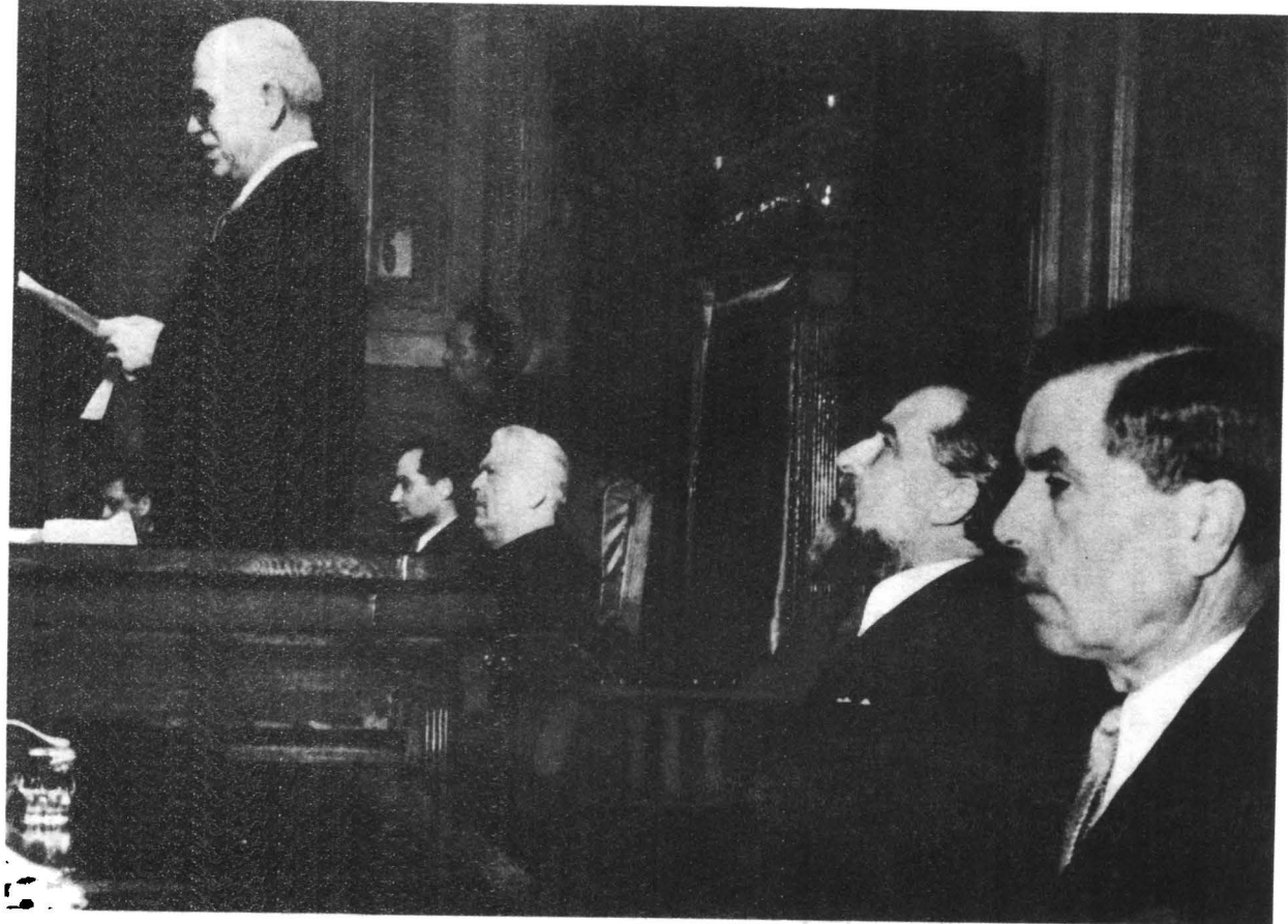
Prezidiul Provizoriu al Republicii Populare Române.