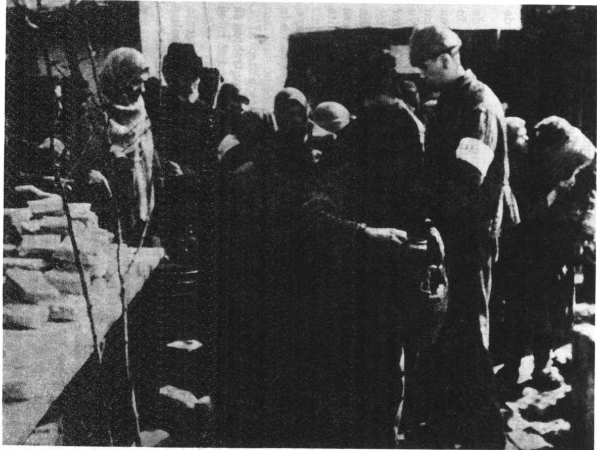
Foametea din 1947.