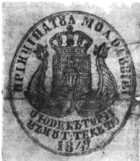
Fig. 18. Sigiliul doc. din 1849 apr. 28, rez. nr. 1108.

Orig., difolio (36×22 cm.), pătat, rupt, patru sigilii. Sigiliu în fum al satului Oțelești, țin. Tecuci, din anul 1840, în tuș al bisericii satului respectiv din anul 1843; în fum al ocolului Berheci, țin. Tecuci, idem doc. nr. 1018. Sigiliu Judecătoriei țin. Tecuci, oval (4/3,5 cm.), în tuș; scut dreptunghiular, pe roșu și albastru capul de bour cu stea între coarne, timbrat de o coroană închisă și susținut de doi delfini afrontați. Legenda: ПРИНЦИПАТЪА МОЛДАВЕИИ ЦЮДЕКЪТОРИИ ЦЪНЪСТ: ТЕСКУЧЮ 1849: