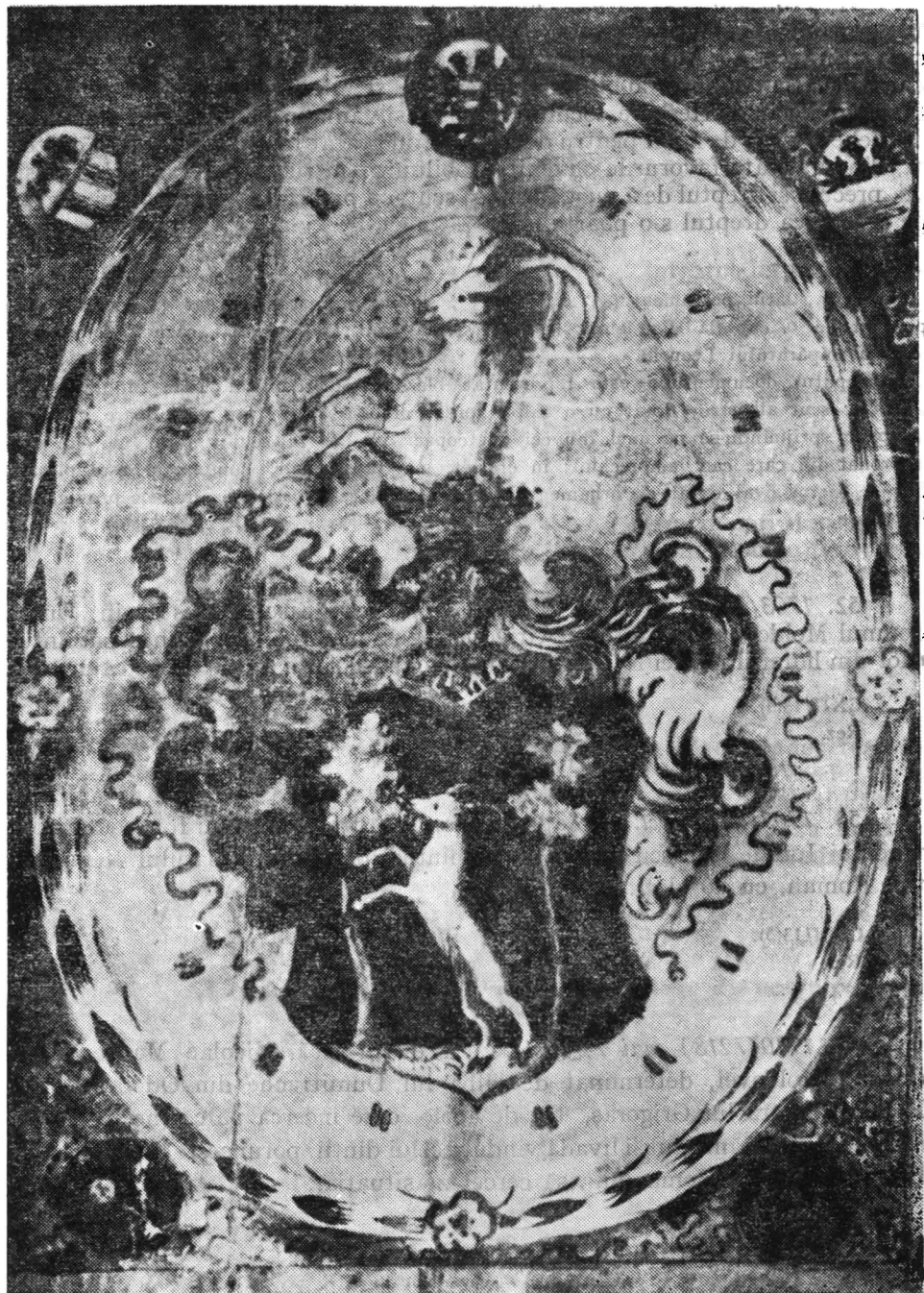
Fig. 1. Blazonul lui Ioan Moldovan de Herbule, doc. din 1702 apr., 19, rez. nr. 51.