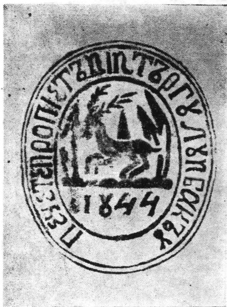
Fig. 17. Sigiliul doc. din 1846 febr. 8, rez. nr. 994.