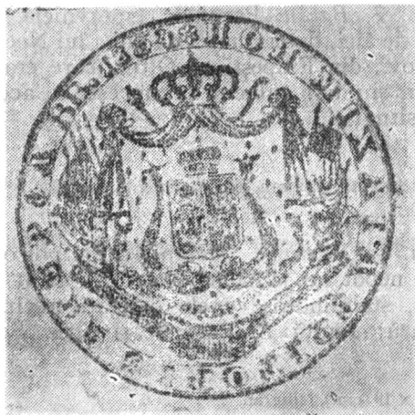
Fig. 15. Sigiliul doc. din 1835 iul. 10, rez. nr. 630.

632. 1835 oct. 18, Iași. Mihai Sturdza, domnul Moldovei, judecă în divan pricina dintre Paisie, egumenul m-rii Precista din Tg. Ocna, și răzeșii din moșia Poiana, țin. Bacău, pentru stăpînirea pămînturilor acestora din urmă pe care mănăstirea le revendica sub pretext că în vechime Delenii, aflată în stăpînirea sa, purtase denumirea de Girtan.