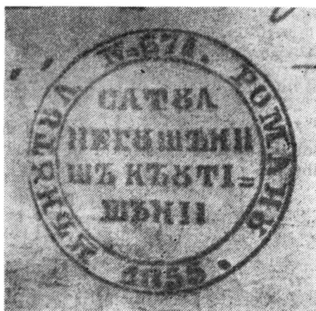
Fig. 19. Sigiliul doc. din 1854 ian. 28, rez. nr. 1454,

Orig., difolio (35×24 cm.), filigran, pătat, rupt la margini și îndoituri, sigiliu în tuș negru al satului Negușeni și Căuțișeni, țin. Roman, din anul 1855.