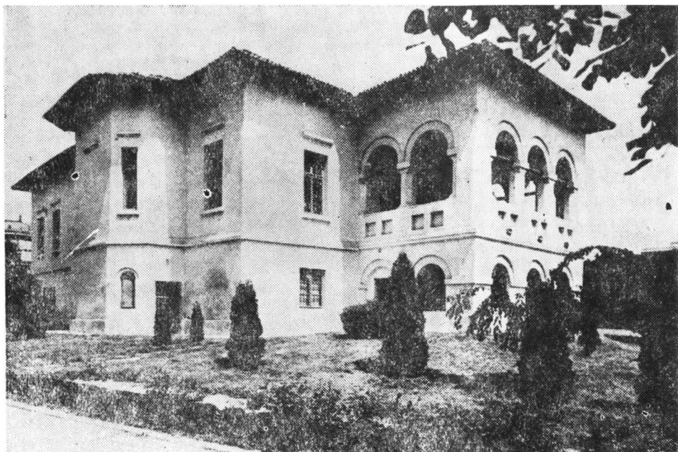
8 — Primul local al Arhivelor Statului din Craiova.

local definitiv, „care să fie sau să treacă în proprietatea ministerului de resort, astfel ca ele să nu mai fie expuse neconținutelor mutări”. 5 Pentru Arhivele Statului se indicau mai multe edificii și anume: Școala primară de băieți „Madona-Dudu”, Casele Băniei sau o altă clădire, cu condiția ca localul ce se va obține să fie în întregime ocupat numai de această instituție.