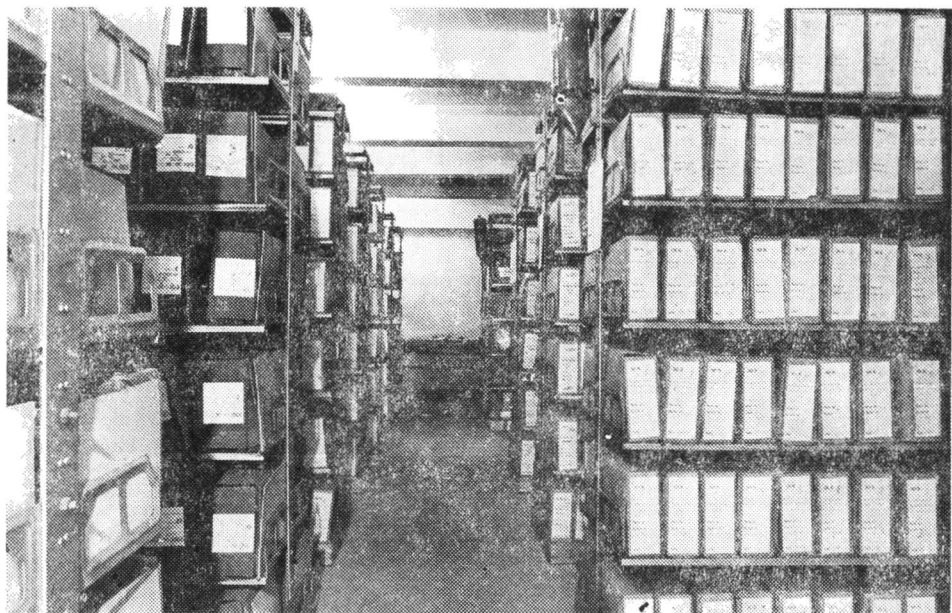
10 — Depozit din noul local.

înființat un laborator de microfilmare, dotat de forul tutelar cu aparatura necesară. În cadrul aceluiași laborator se efectuează și lucrări de multiplicare a documentelor prin foto-reproducere.