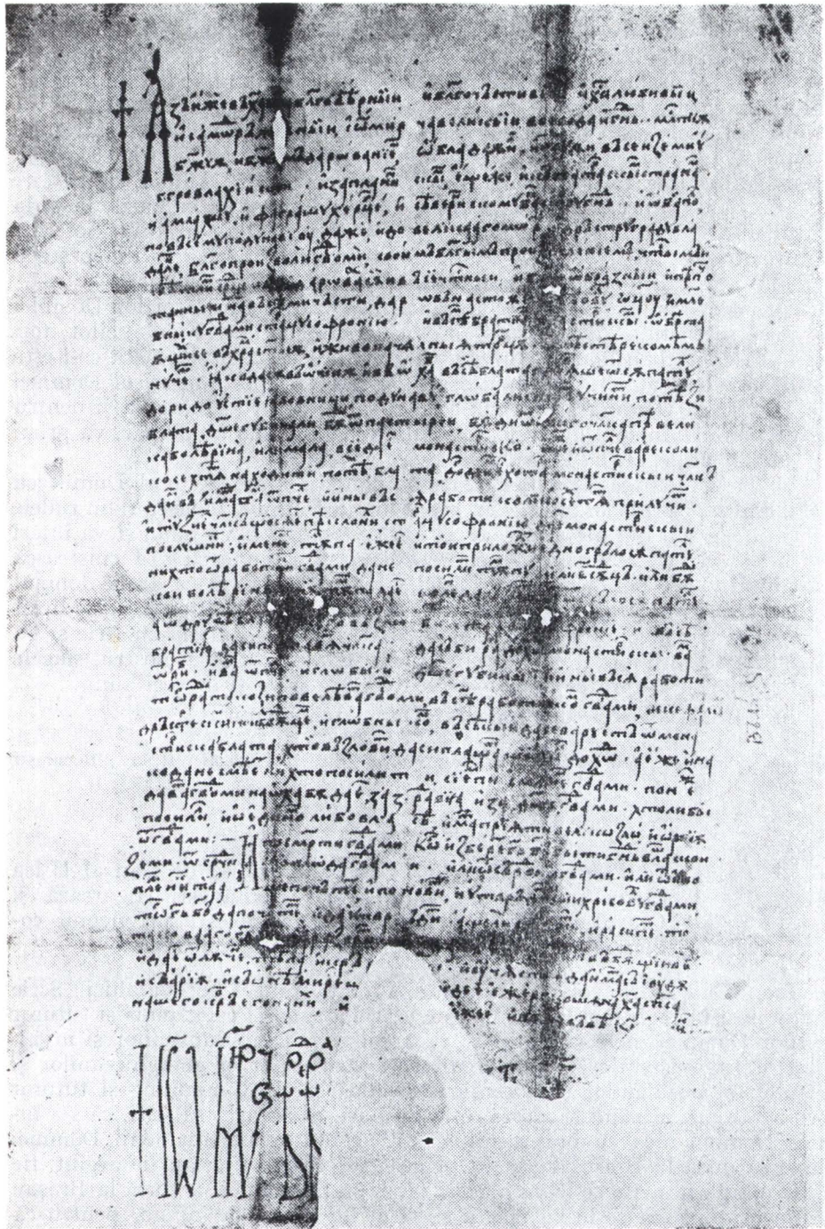
I. 1387. Hrisov prin care Mircea v. Tării Românești întărește mănăstirea Nucet stăpînirea peste toate baltile pînă la Gura Ialomiței.